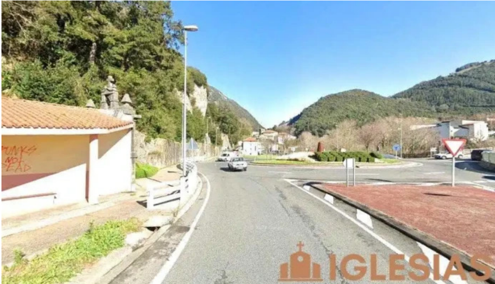
Paduako san antonio ermita ermita de san antonio de padua mendarozabal