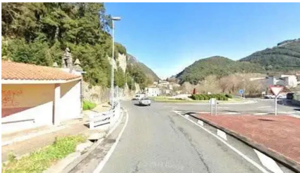
Paduako san antonio ermita ermita de san antonio de padua iglesia