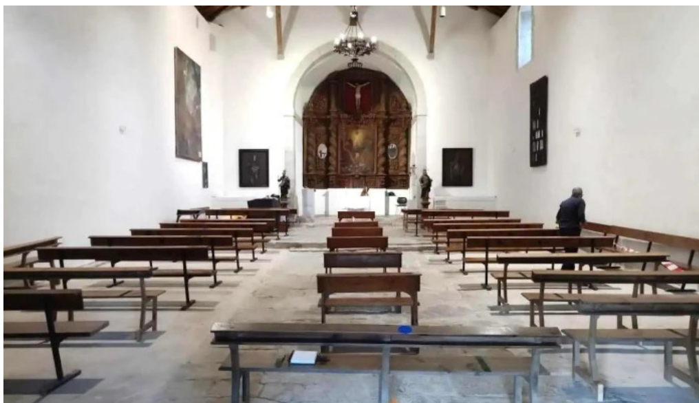
Ermita de la santísima trinidad mendaro