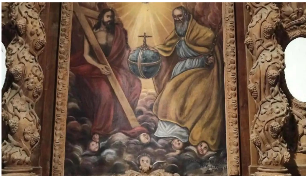
Ermita de la santísima trinidad iglesia