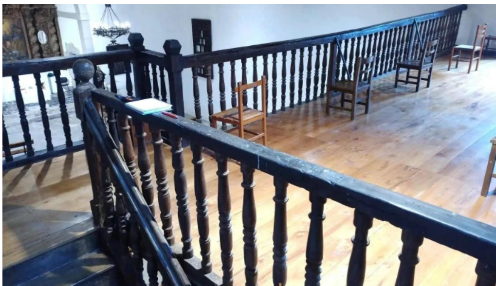
Ermita de la santísima trinidad del propietario