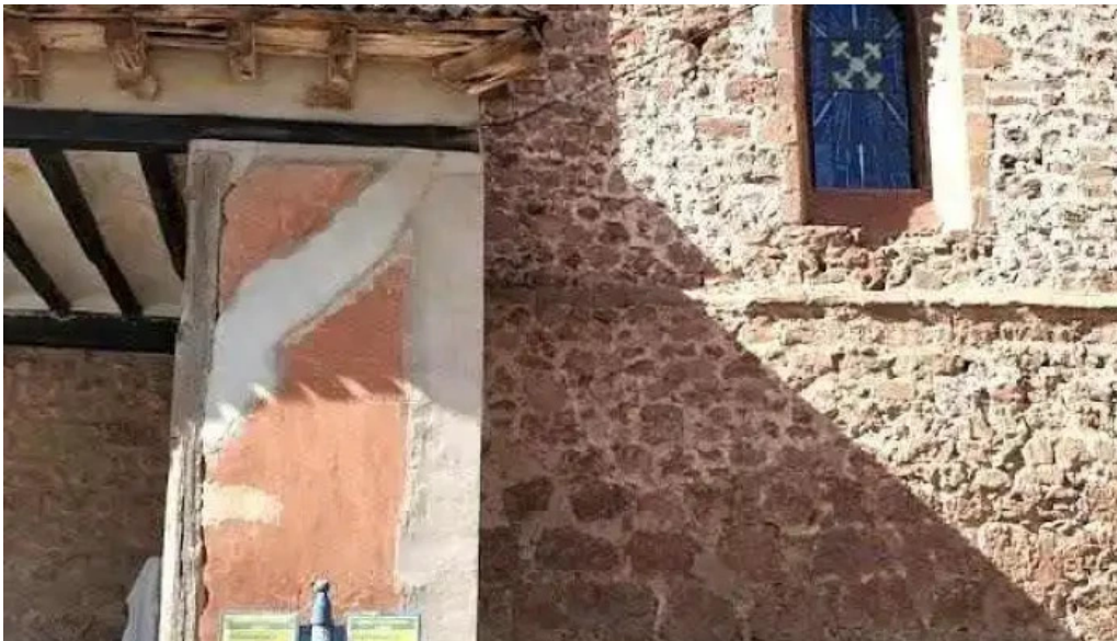
Iglesia parroquial de san roman matute