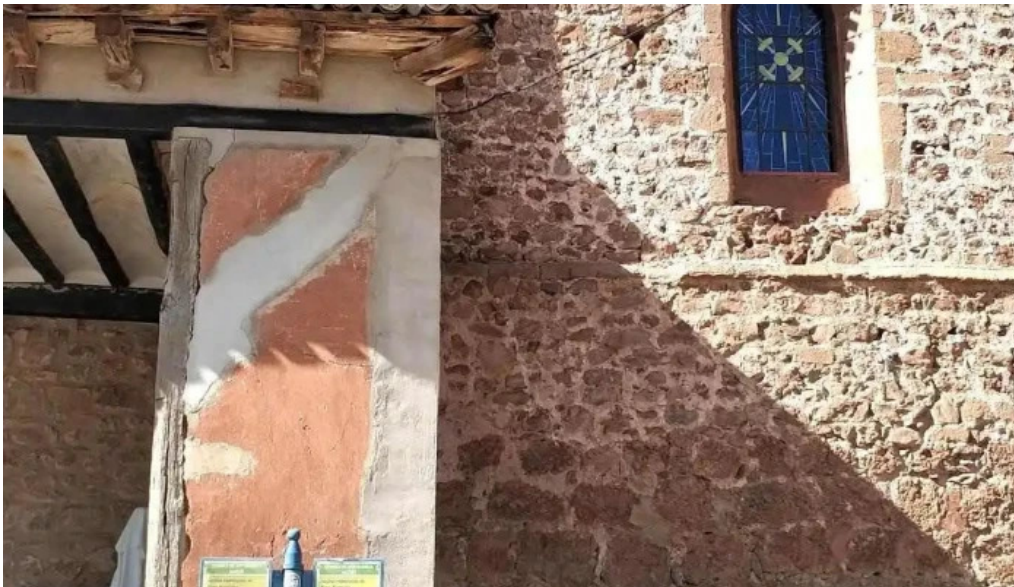
Iglesia parroquial de san roman iglesia