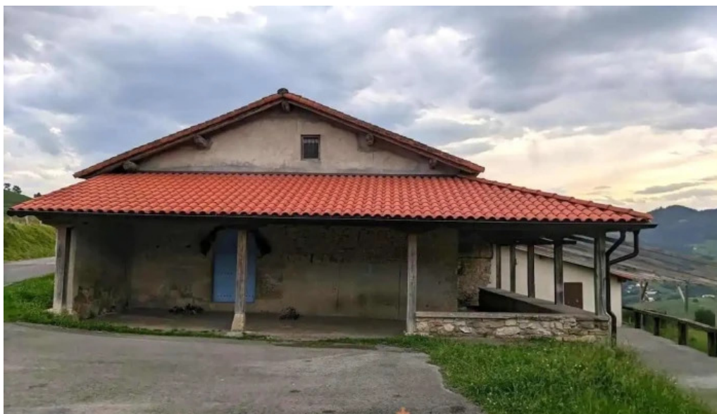
Ermita de san cristobal markina xemein