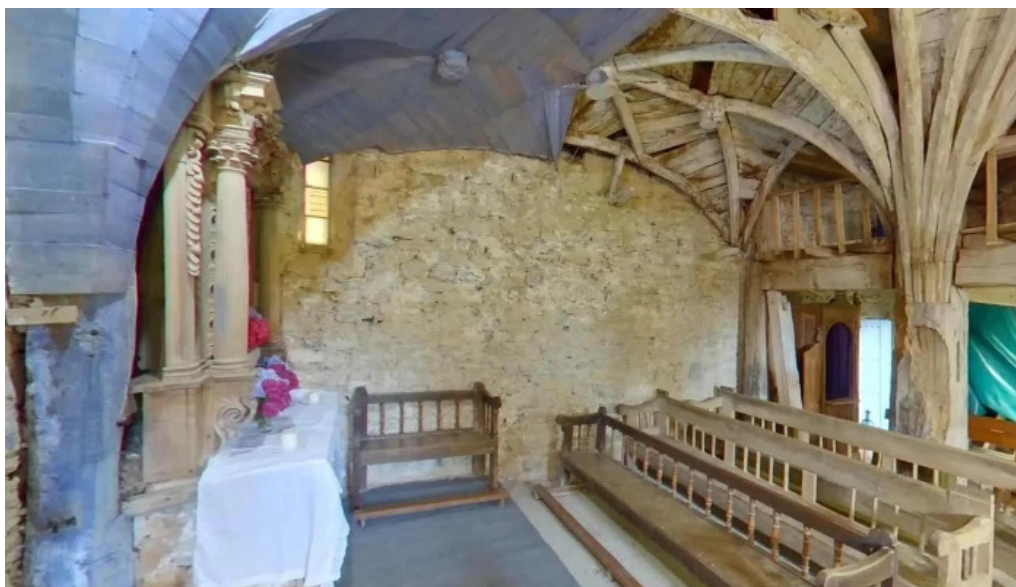
Ermita de san cristobal iglesia