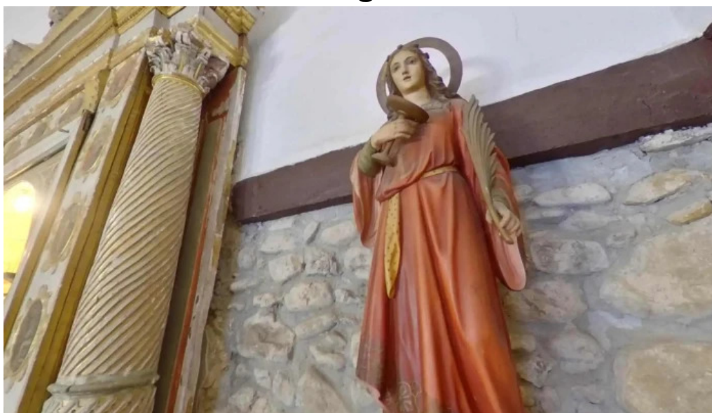
Ermita de nuestra senora de las nieves videos