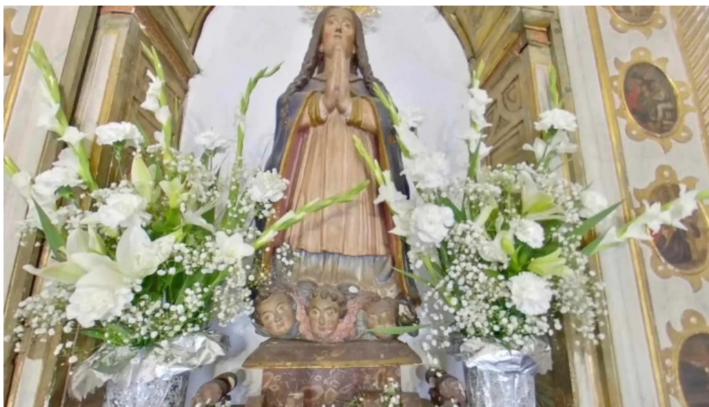
Ermita de nuestra senora de las nieves iglesia