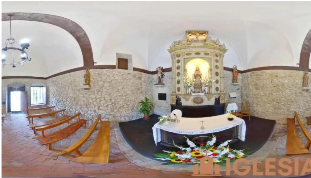
Ermita de nuestra senora de las nieves markina xemein