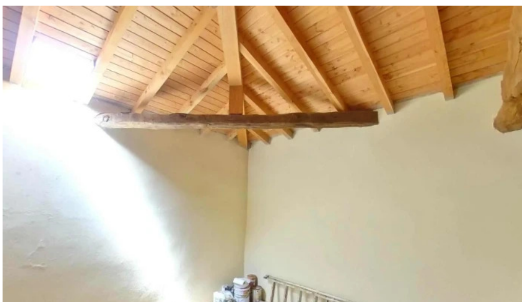
Ermita de la santa cruz de etxarte bo barinaga abierto ahora