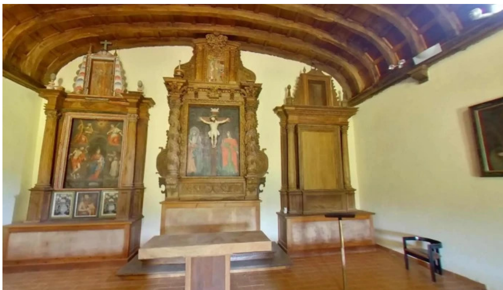
Ermita de la santa cruz de etxarte bo barinaga iglesia