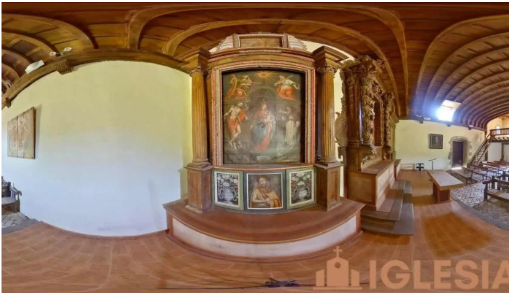
Ermita de la santa cruz de etxarte bº barinaga markina xemein