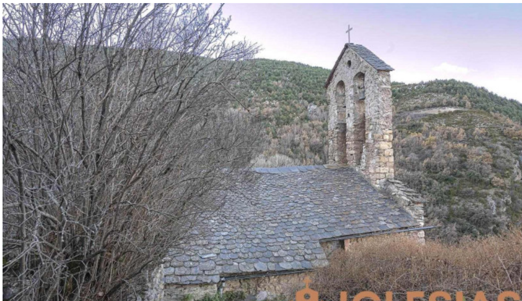
Iglesia de sant andreu de malmercat malmercat