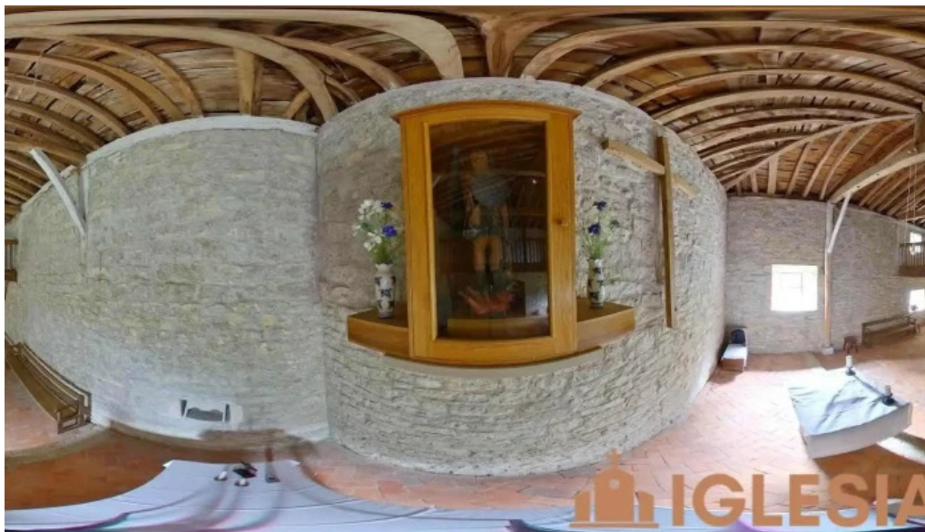
Ermita de san miguel mallabia