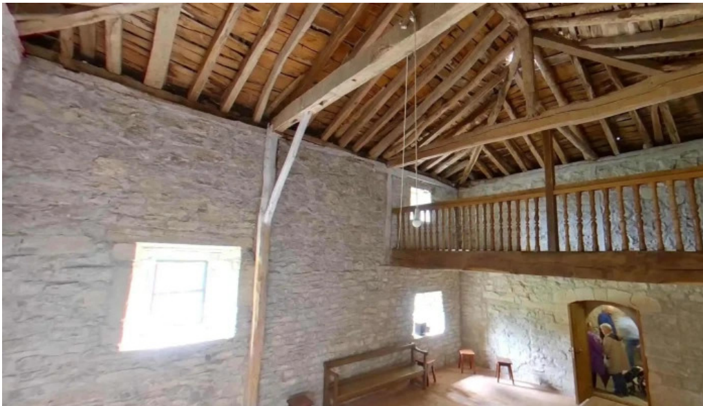
Ermita de san miguel iglesia