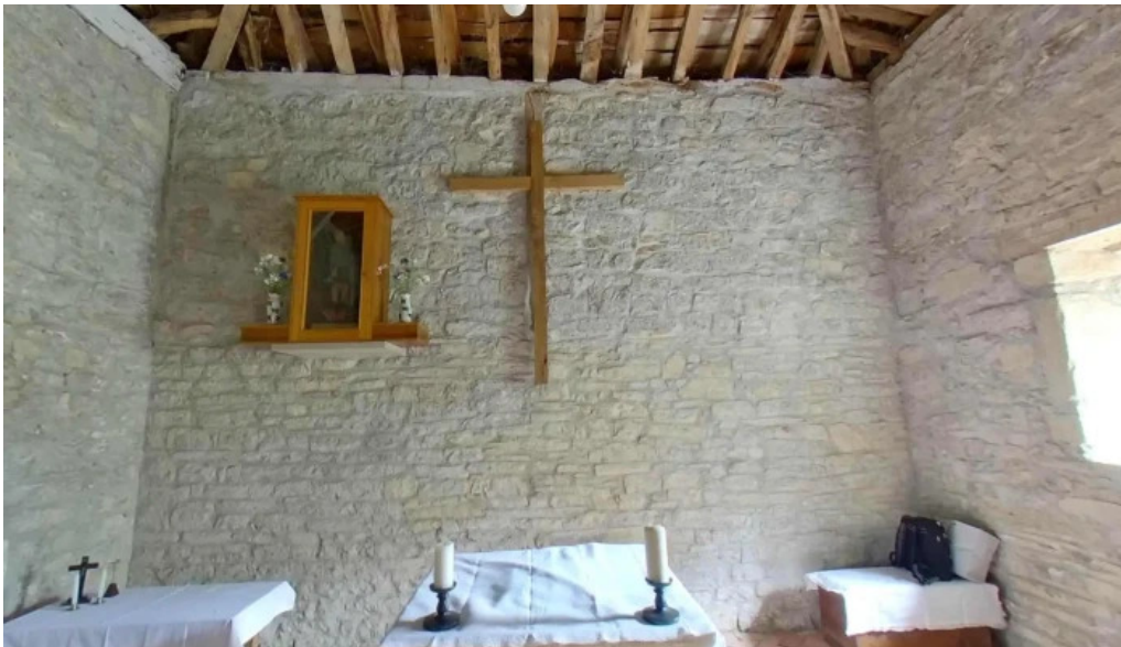
Ermita de san miguel descuentos