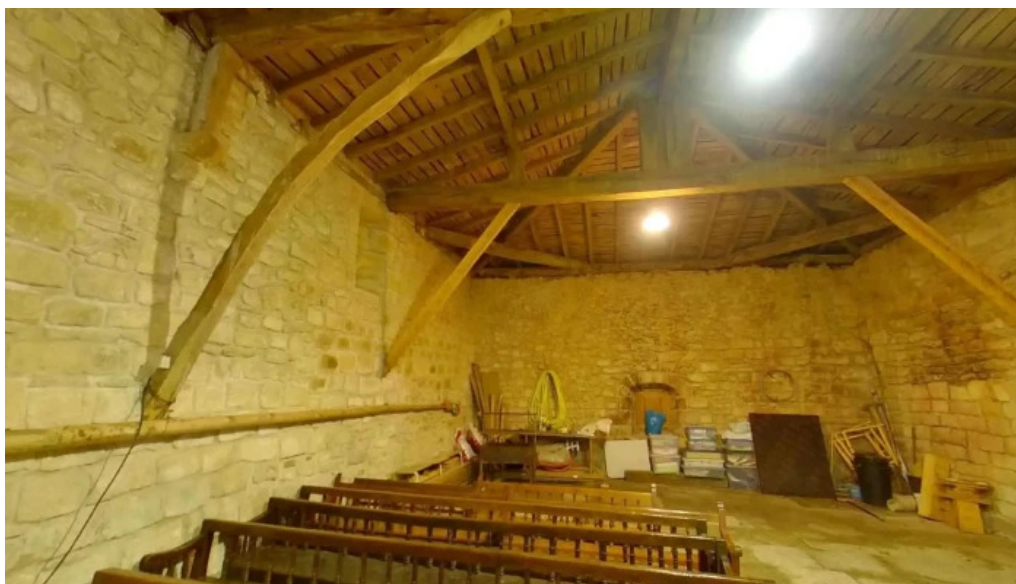
Ermita de san juan cerca de mi