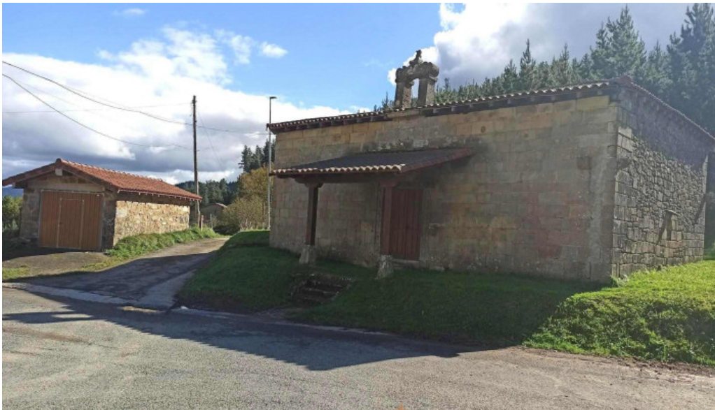
Ermita de san juan iglesia