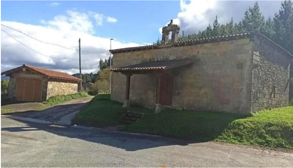
Ermita de san juan mallabia