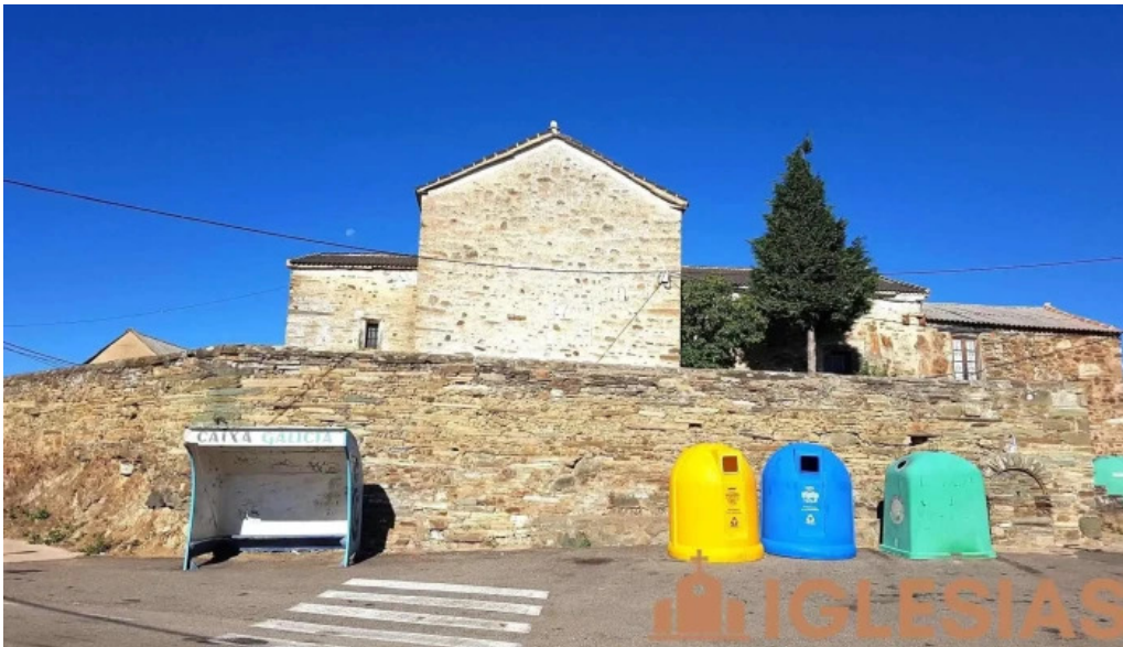
Iglesia de san martin iglesia