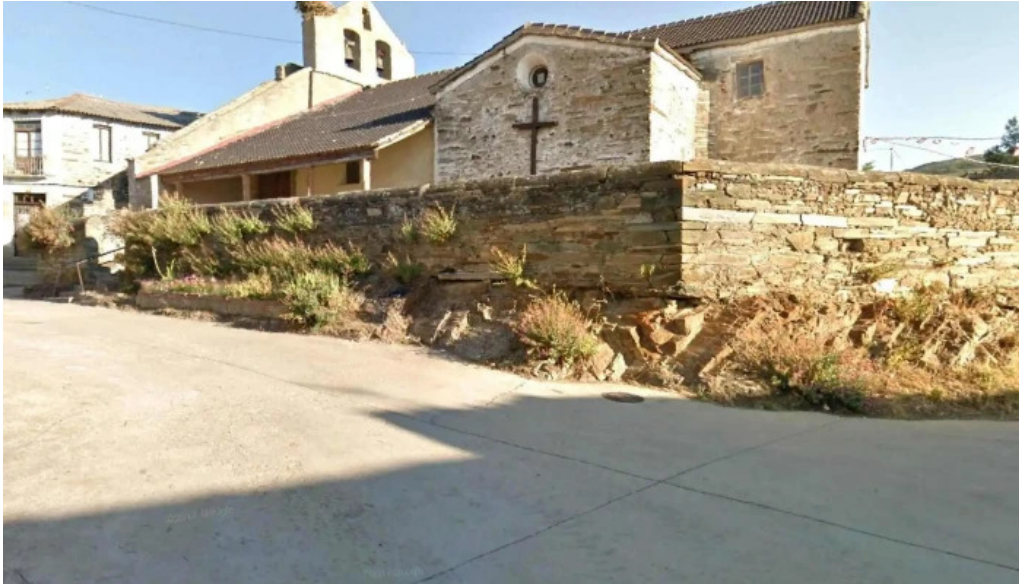
Iglesia de san martin lucillo