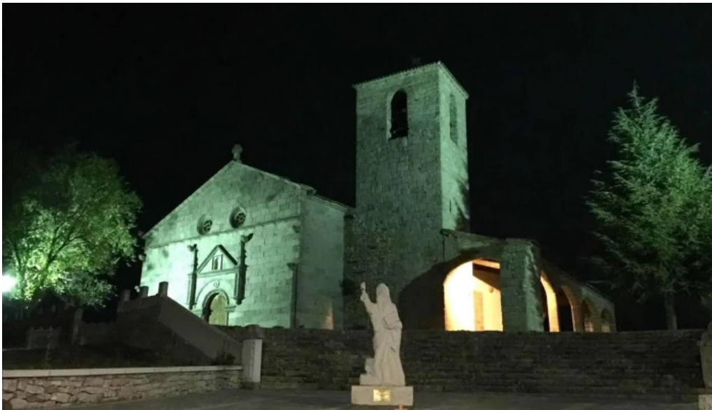
Iglesia fortaleza de san bartolome iglesia