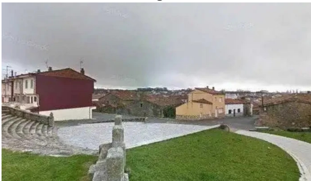
Iglesia fortaleza de san bartolome puntaje