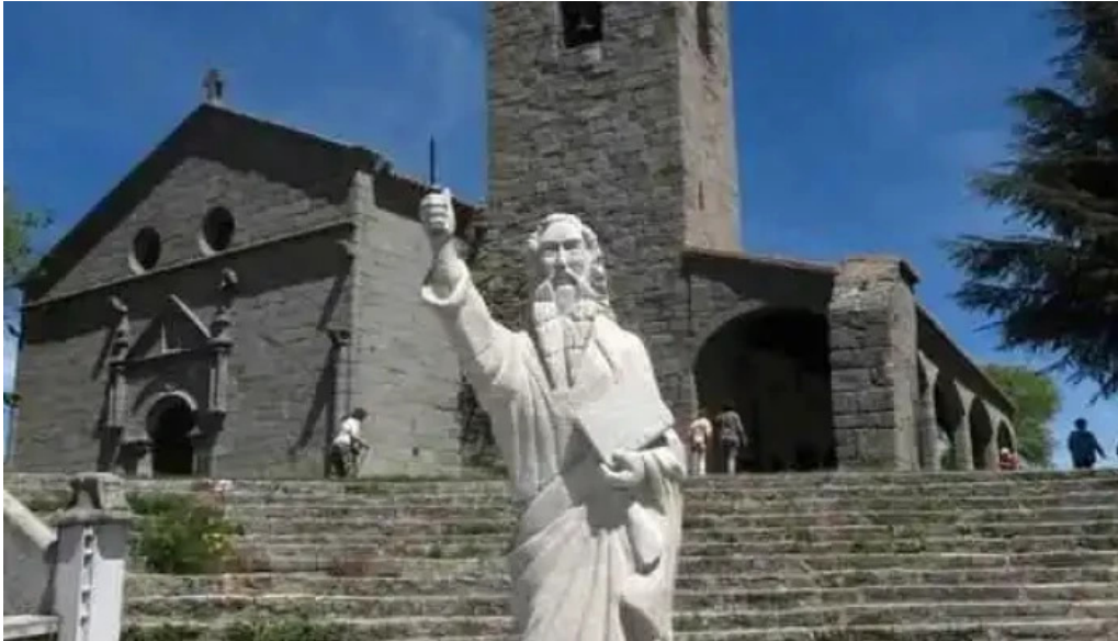
Iglesia fortaleza de san bartolome los santos