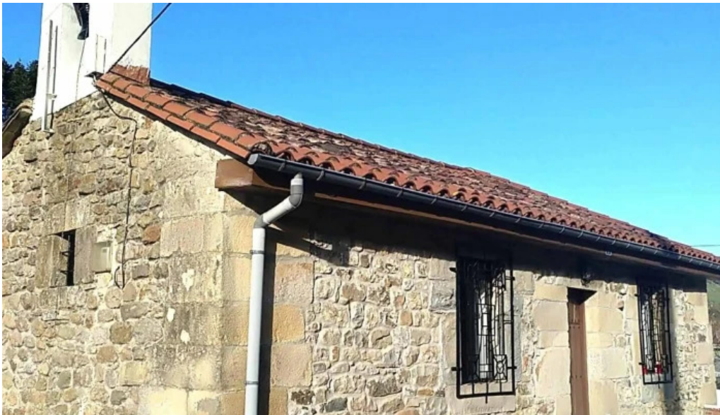
Ermita de santa ana los llares