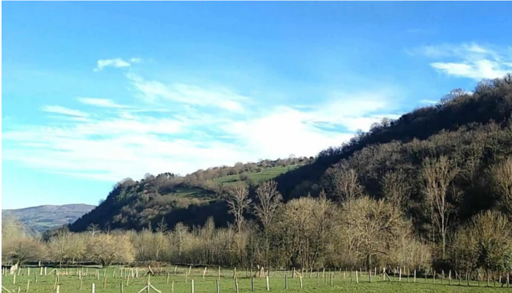
Ermita de santa ana instagram