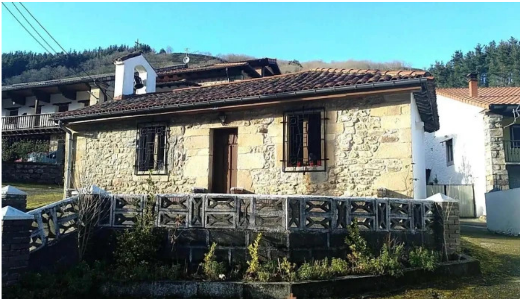
Ermita de santa ana iglesia