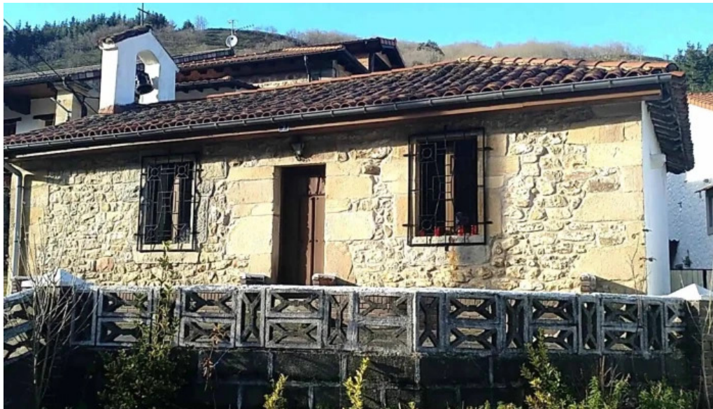
Ermita de santa ana opiniones