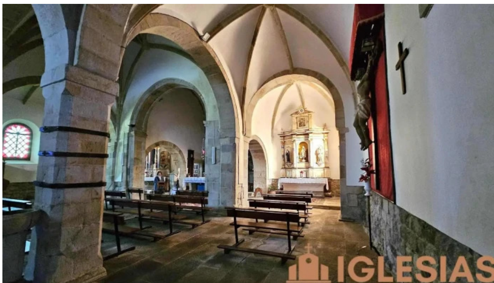
Iglesia de san martin en coo iglesia