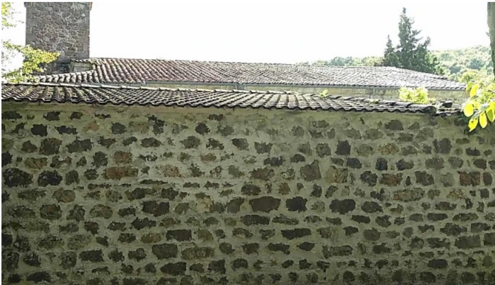
Iglesia de san martin en coo los corrales de buelna