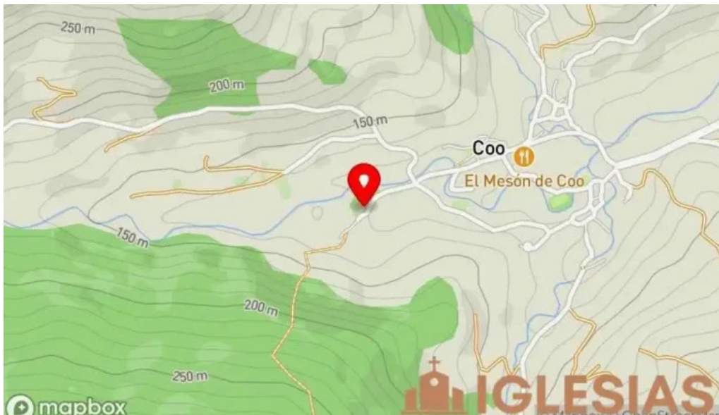
Iglesia de san martin en coo mapa