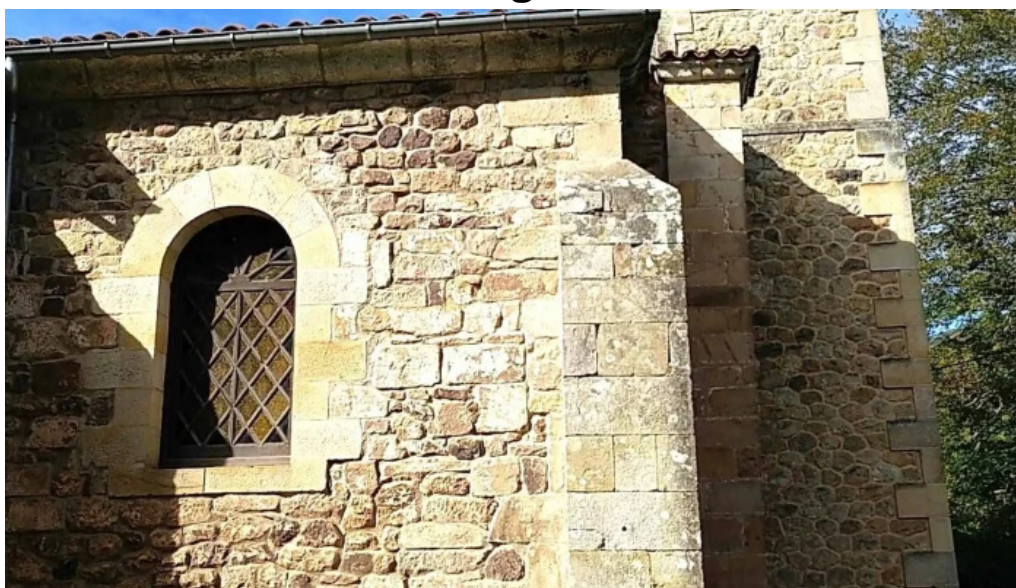
Iglesia de san martin en coo videos