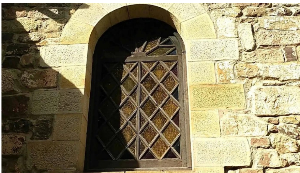
Iglesia de san martin en coo precios