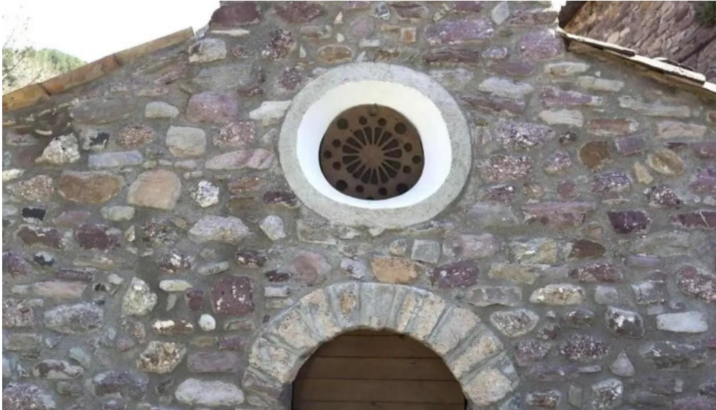
San sebastian de lluca iglesia