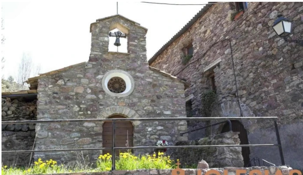
San sebastian de Illuça Illuça