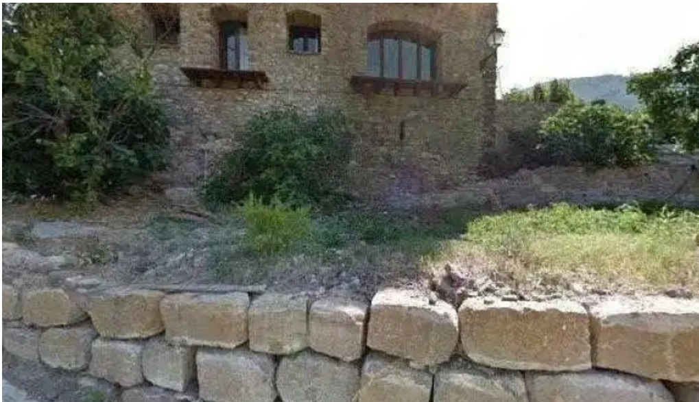
San sebastian de lluca direccion