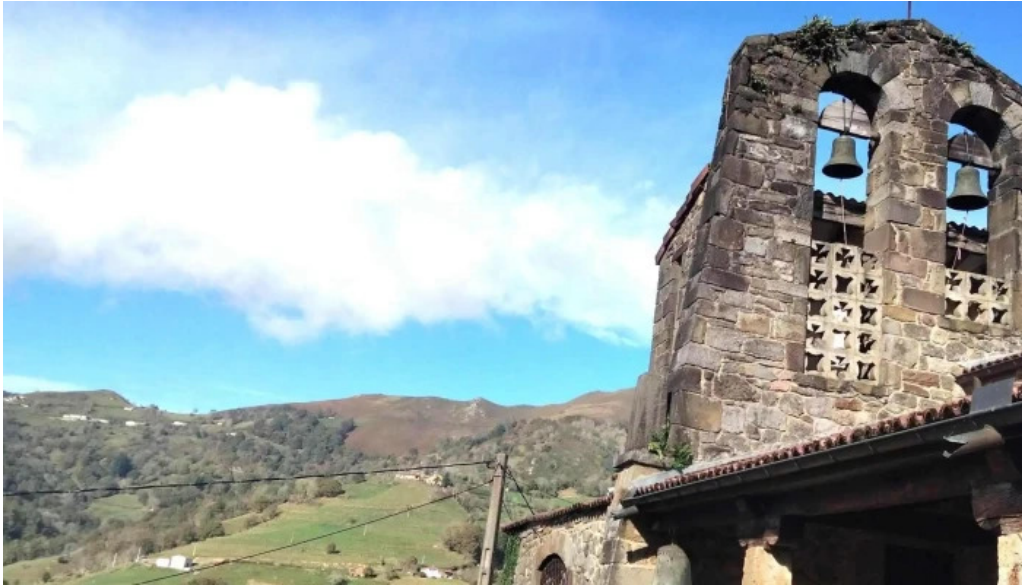
Iglesia san cosme videos