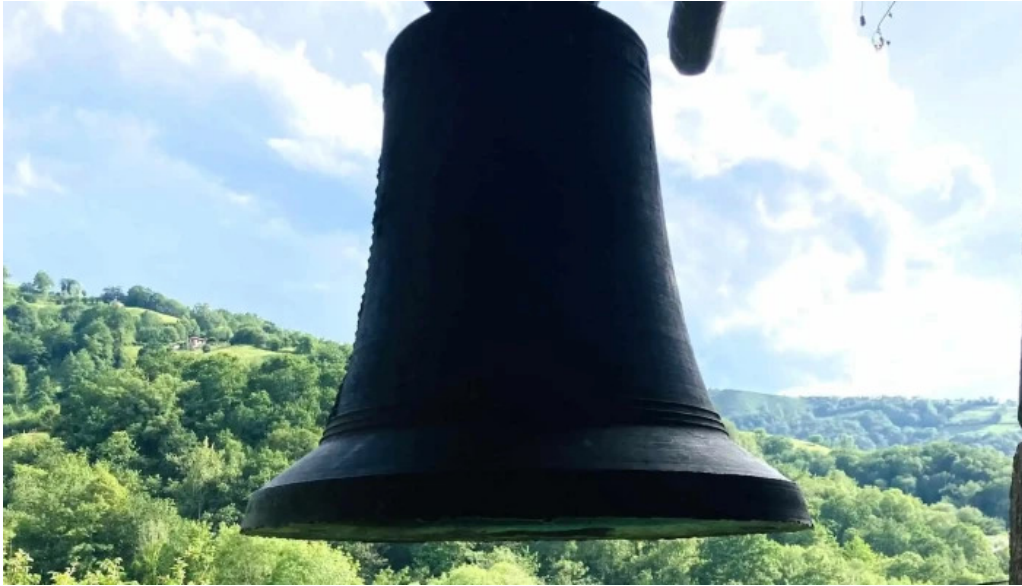
Iglesia san cosme puntaje