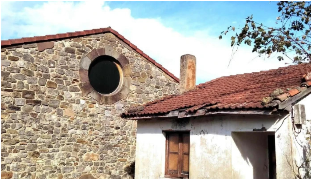
Iglesia san cosme ubicacion