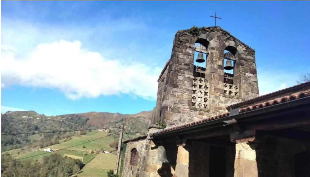
Iglesia san cosme iglesia