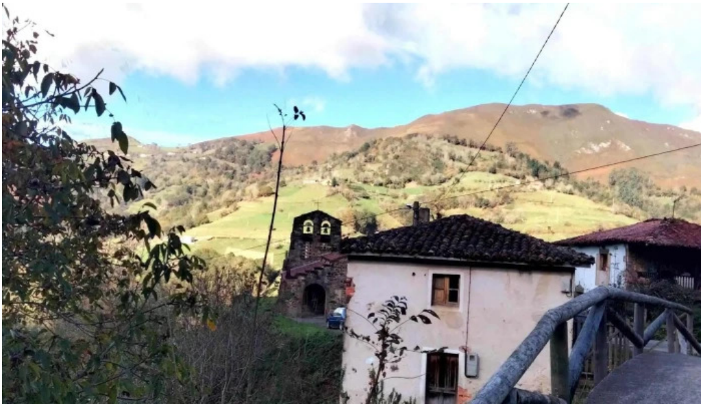
Iglesia san cosme numero