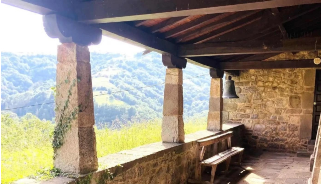
Iglesia san cosme telefono