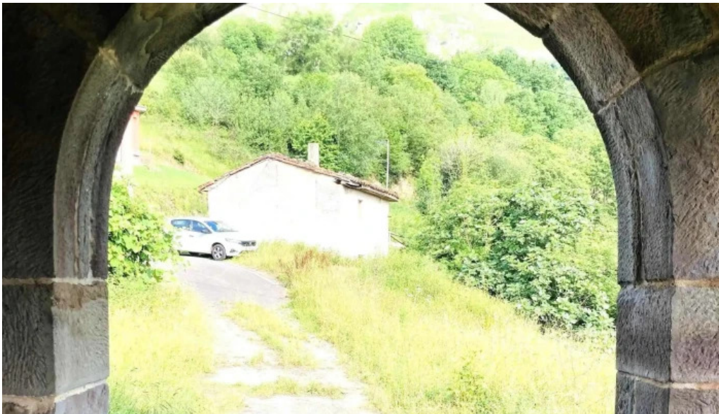
Iglesia san cosme direccion