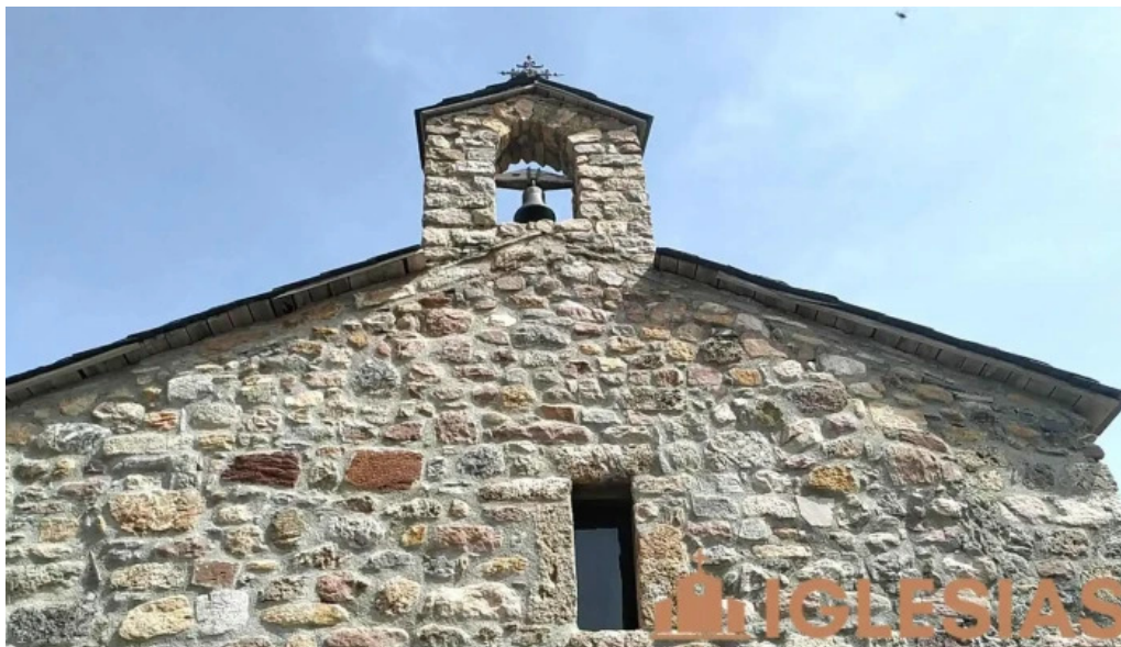
Sant marti de taus lleida