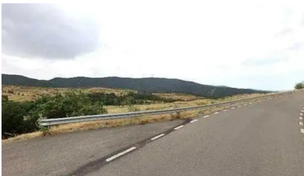
Sant marti de taus fotos