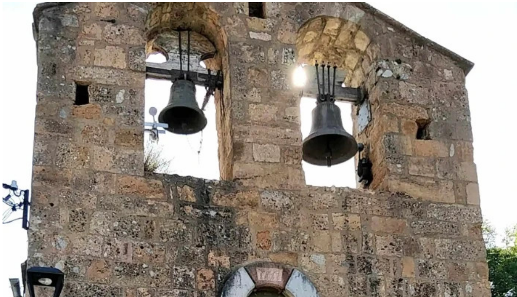
Iglesia de sant serni de prats direccion