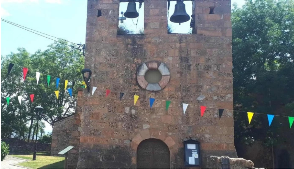
Iglesia de sant serni de prats precios