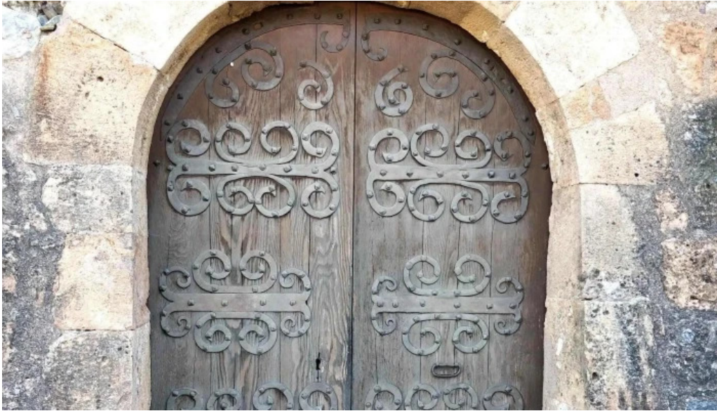
Iglesia de sant serni de prats lleida