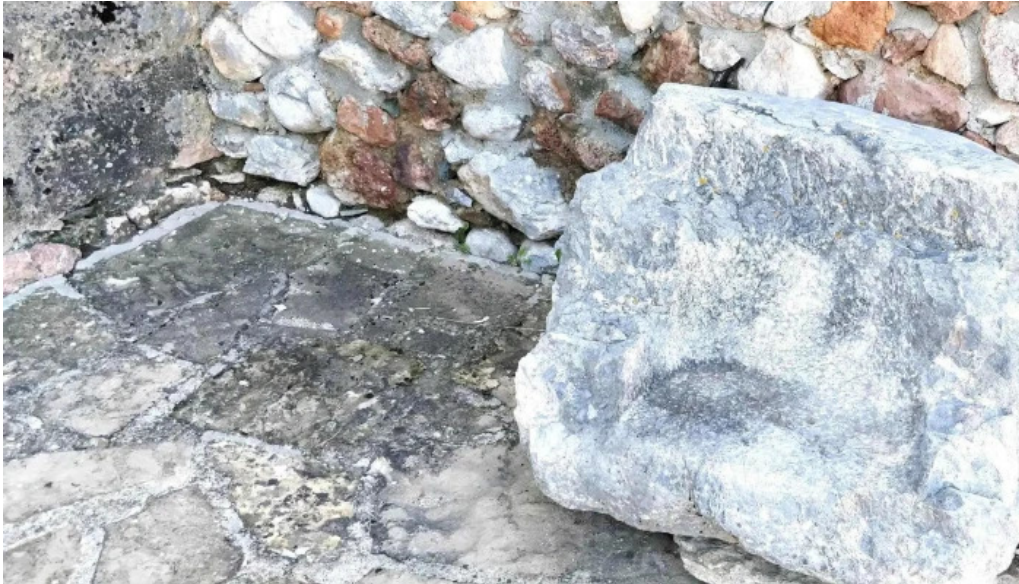
Iglesia de sant serni de prats comentarios