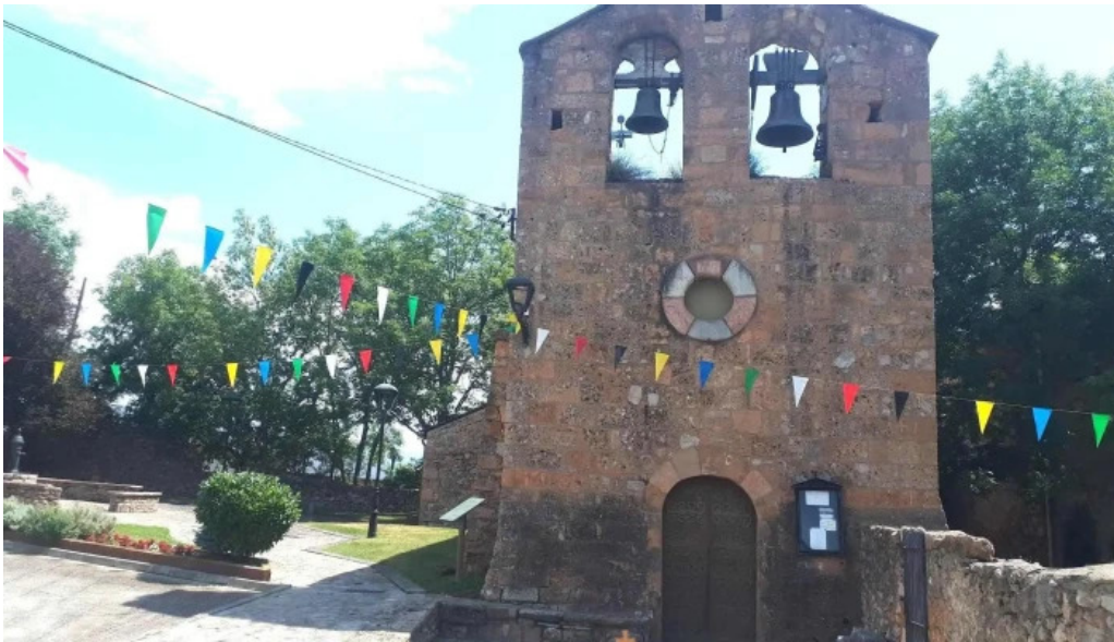
Iglesia de sant serni de prats iglesia