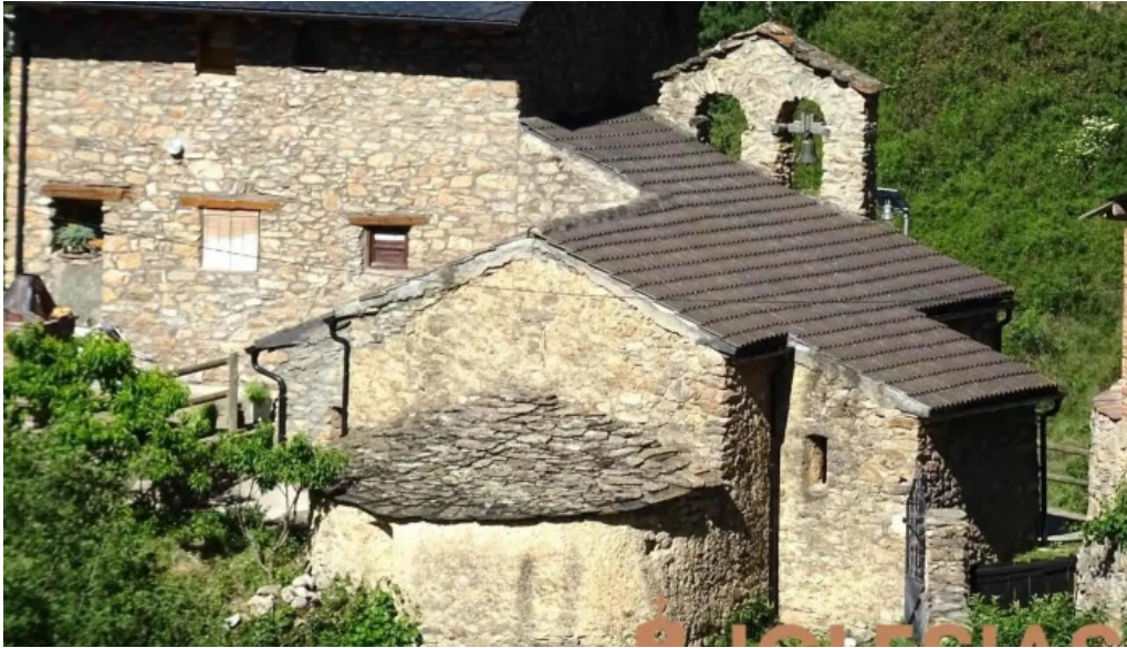
Iglesia de la concepcio o de santa maria de miravall iglesia