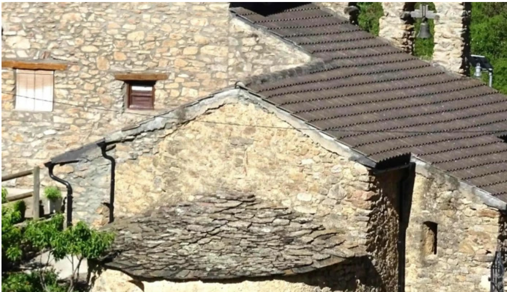
Iglesia de la concepcio o de santa maria de miravall comentarios