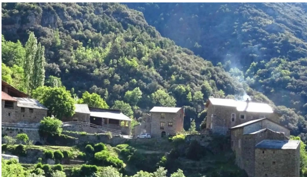
Iglesia de la concepcio o de santa maria de miravall cerca de mi