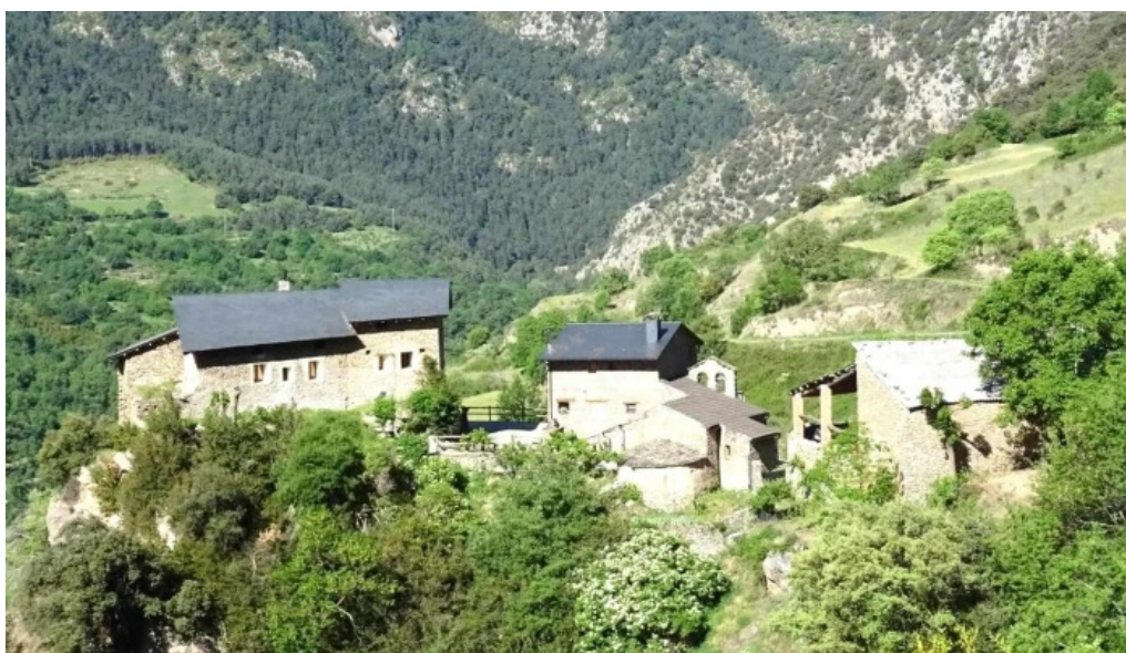
Iglesia de la concepcio o de santa maria de miravall lleida