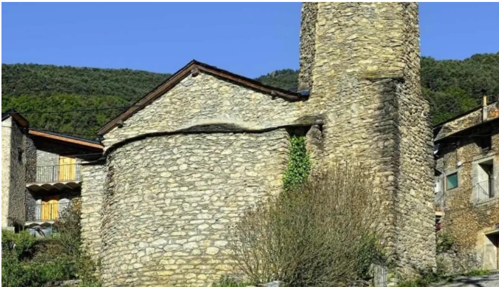
Esglesia parroquial de sant joan fumat iglesia