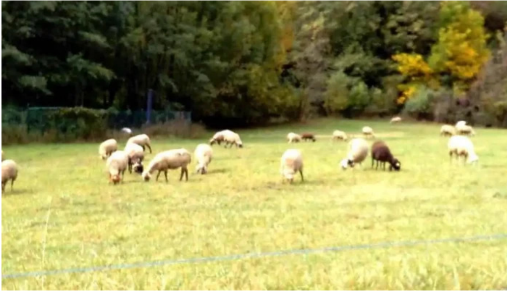
Esglesia parroquial de sant joan fumat videos