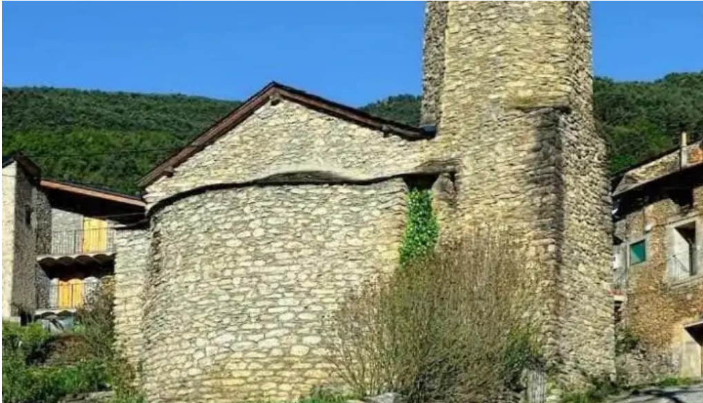
Esglesia parroquial de sant joan fumat lleida