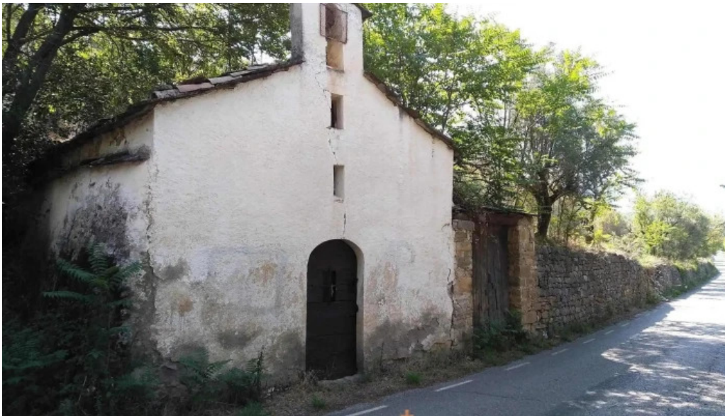
Capilla de los socorros iglesia