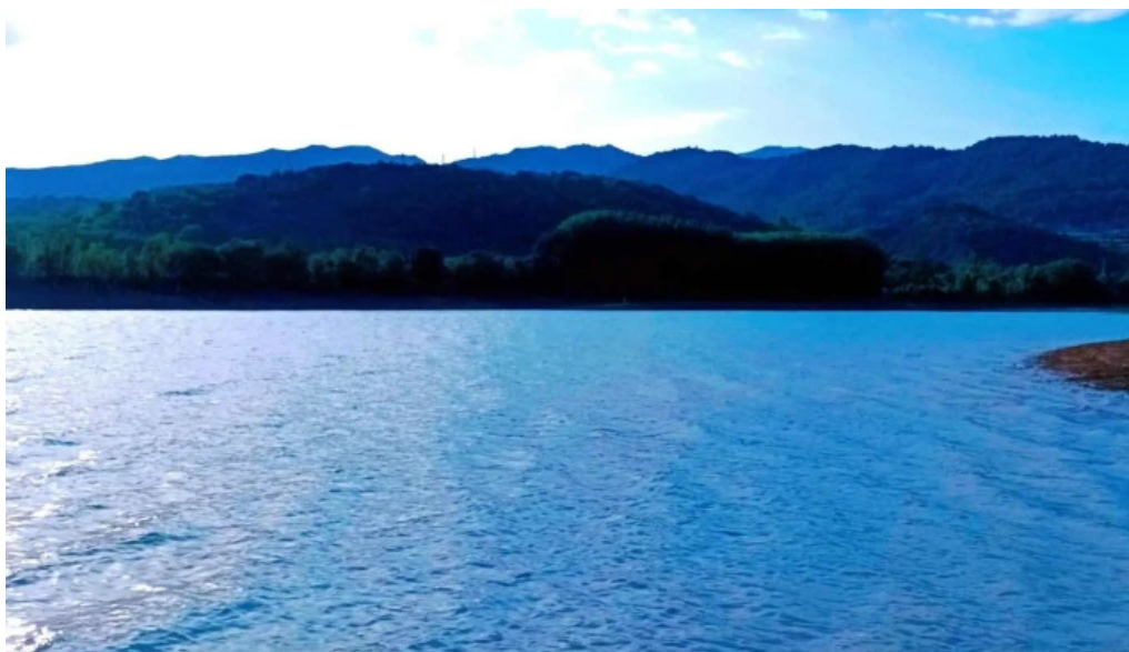
Capilla de los socorros como llegar