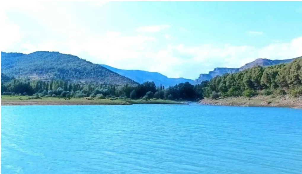
Capilla de los socorros lleida