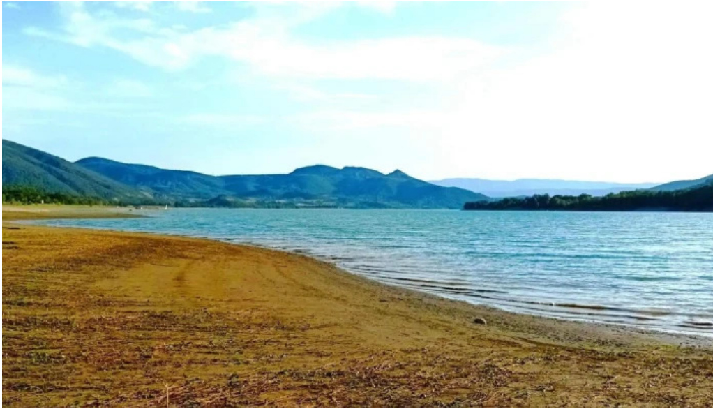
Capilla de los socorros instagram