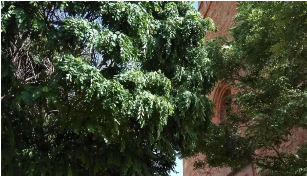
Ermita de santa ana instagram