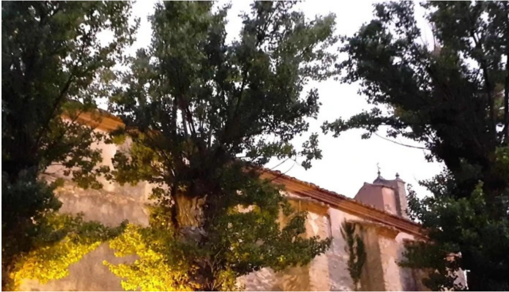
Ermita de santa ana linares de mora