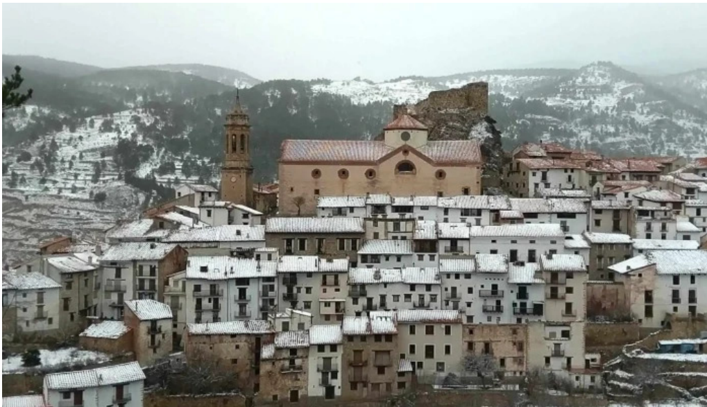
Ermita de santa ana comentarios