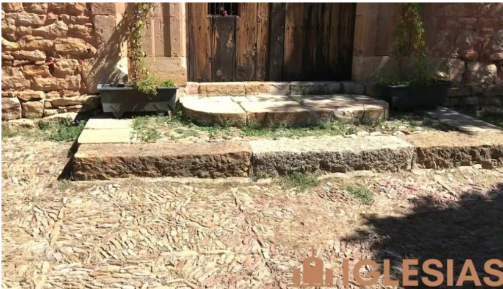
Ermita de santa ana videos