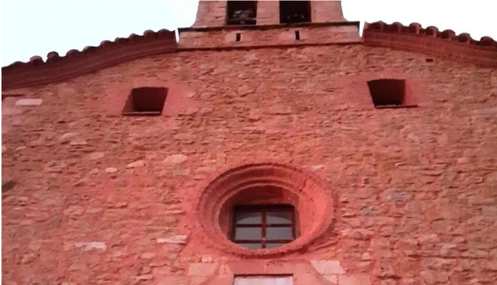
Ermita de santa ana descuentos