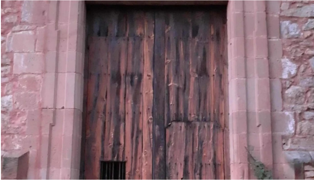
Ermita de santa ana promocion