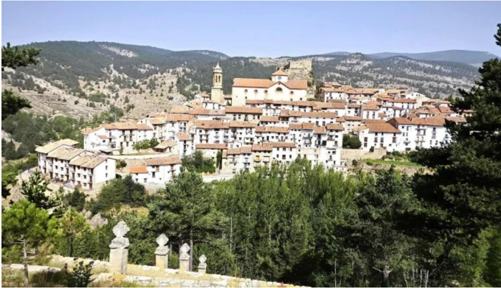
Ermita de santa ana iglesia