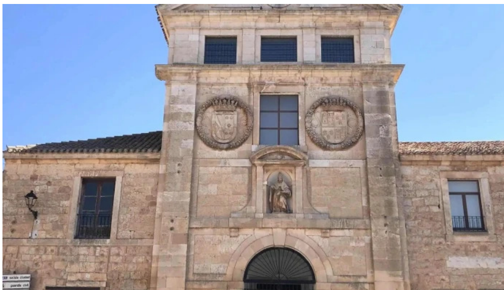
Iglesia de san blas comentario 1