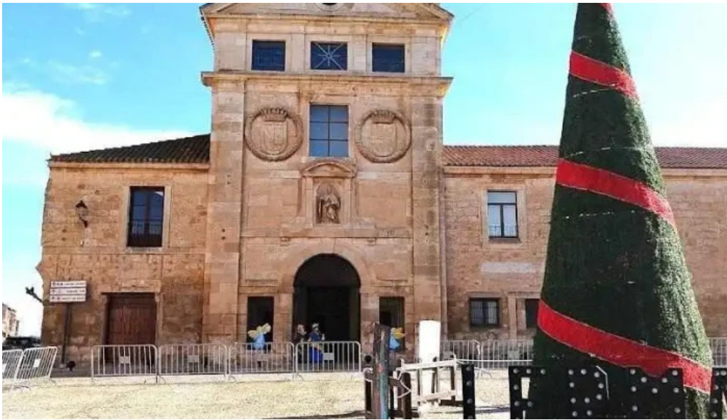
Iglesia de san blas lerma