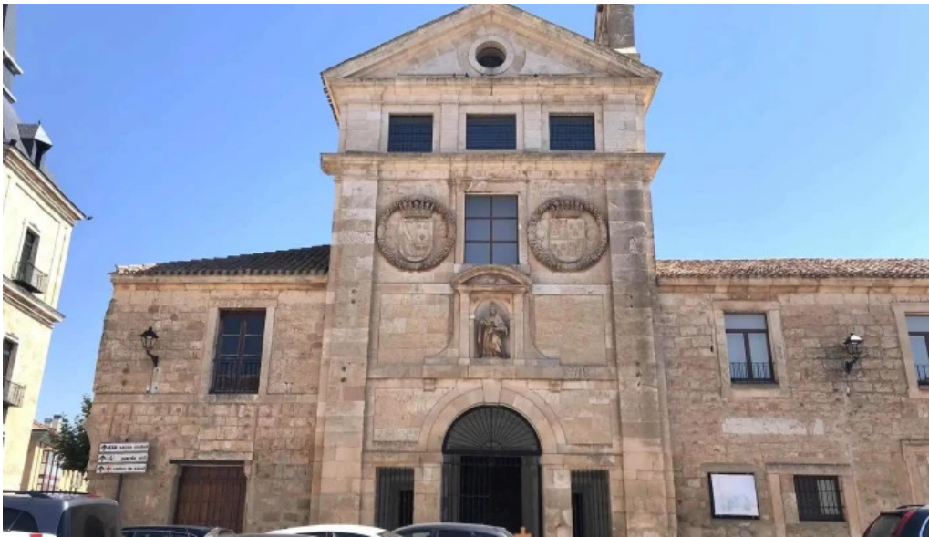
Iglesia de san blas iglesia