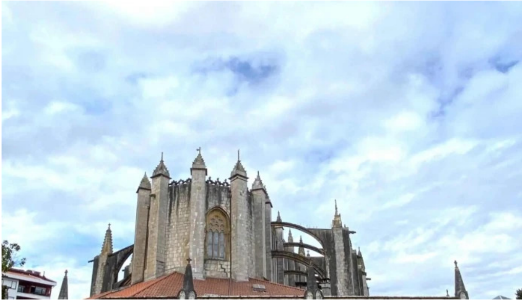
Iglesia basilica de la asuncion de maria santa maria descuentos