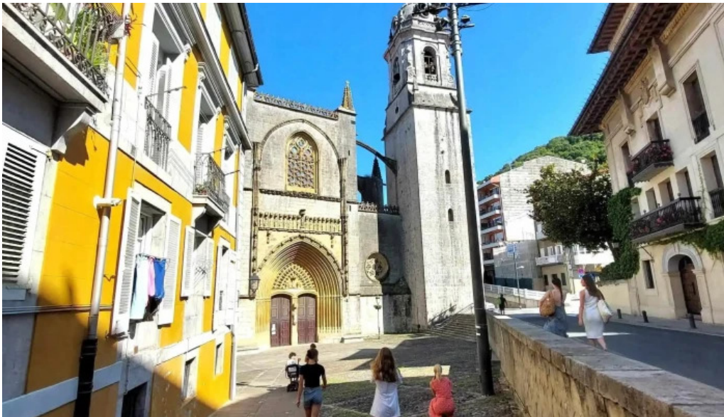
Iglesia basilica de la asuncion de maria santa maria como llegar