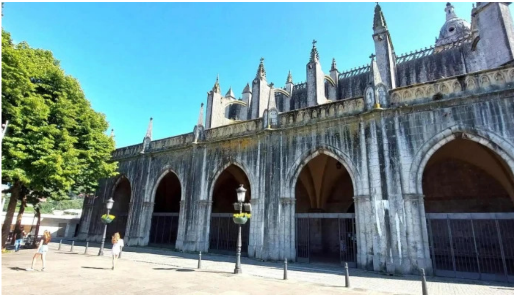
Iglesia basilica de la asuncion de maria santa maria donde