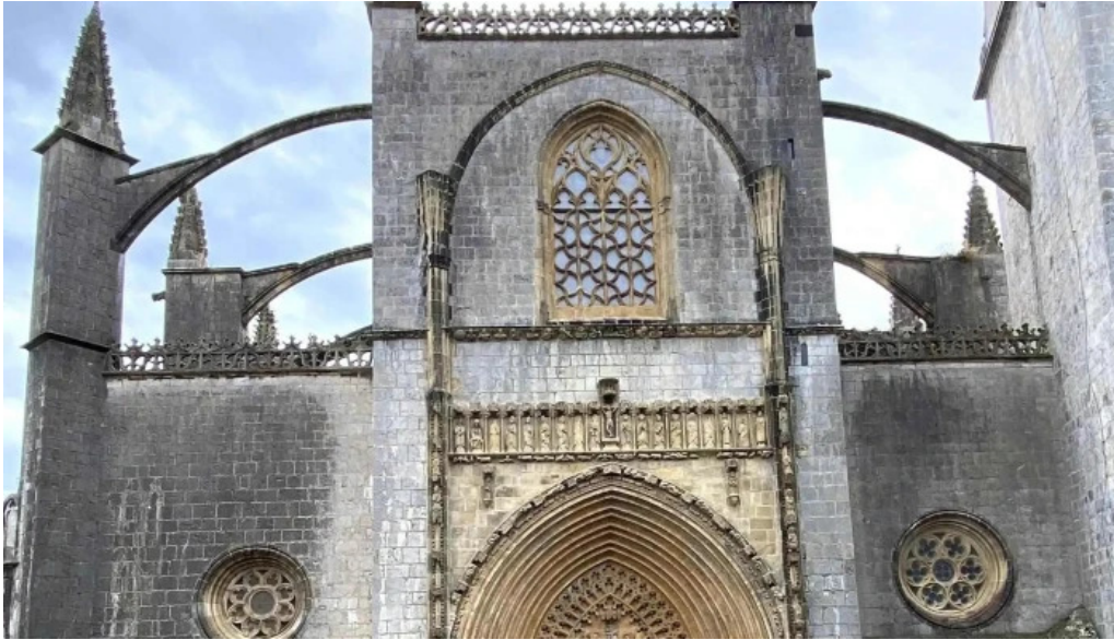
Iglesia basilica de la asuncion de maria santa maria sitio web