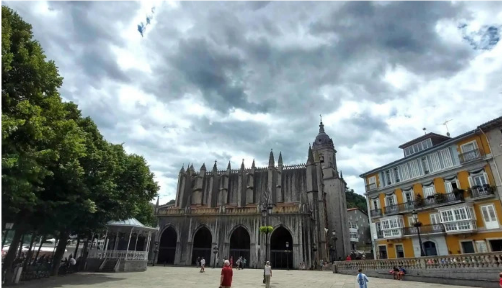
Iglesia basilica de la asuncion de maria santa maria comentarios