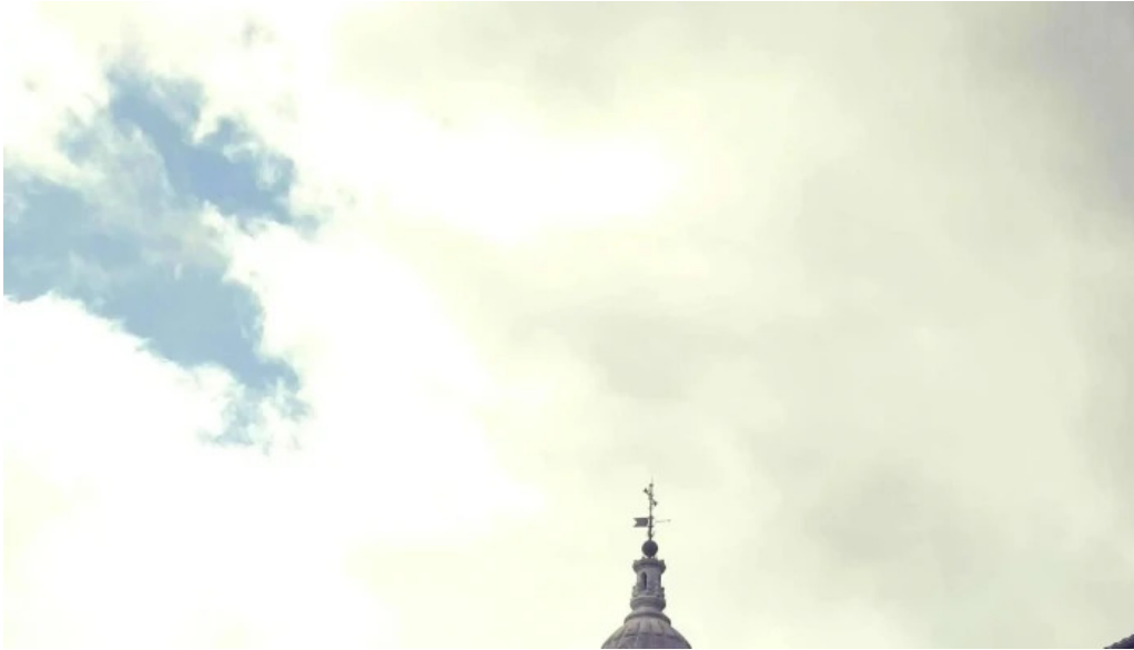
Iglesia basilica de la asuncion de maria santa maria videos