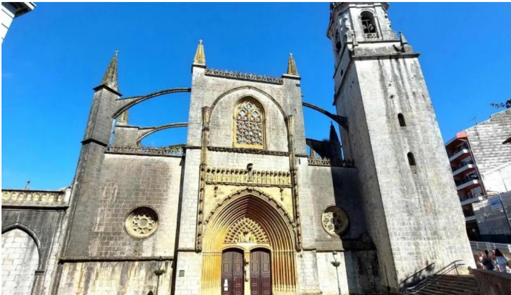
Iglesia basilica de la asuncion de maria santa maria instagram