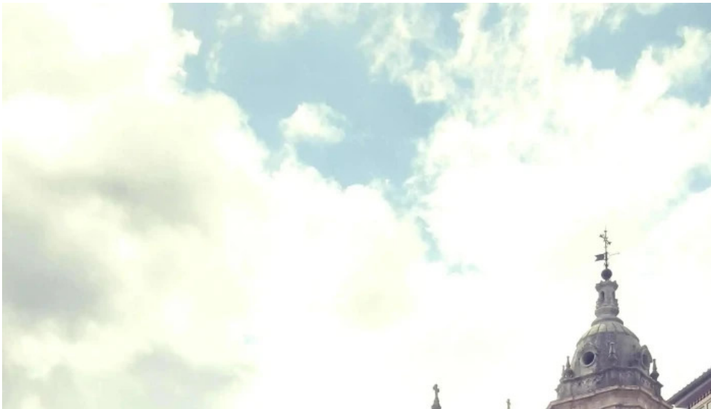
Iglesia basilica de la asuncion de maria santa maria opiniones