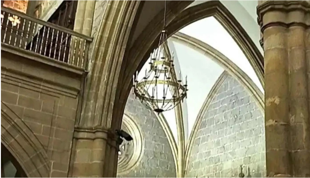
Iglesia basilica de la asuncion de maria santa maria iglesia