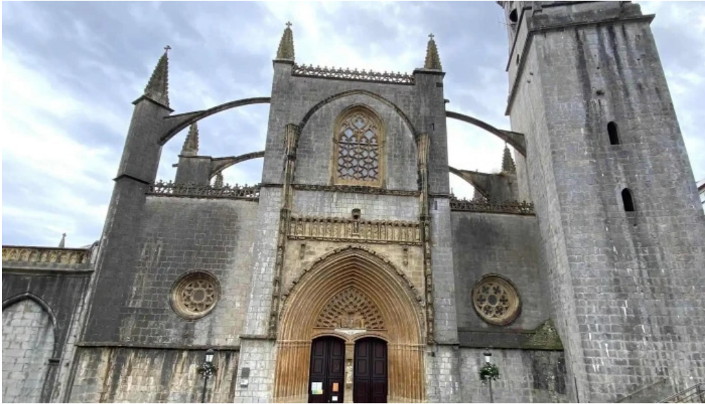
Iglesia basilica de la asuncion de maria santa maria lekeitio