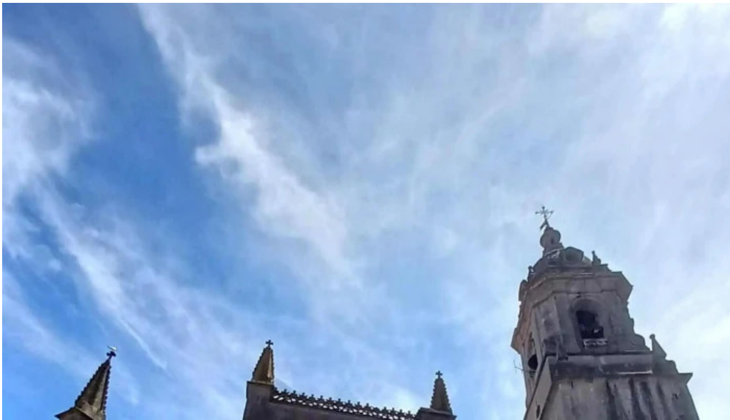
Iglesia basilica de la asuncion de maria santa maria telefono