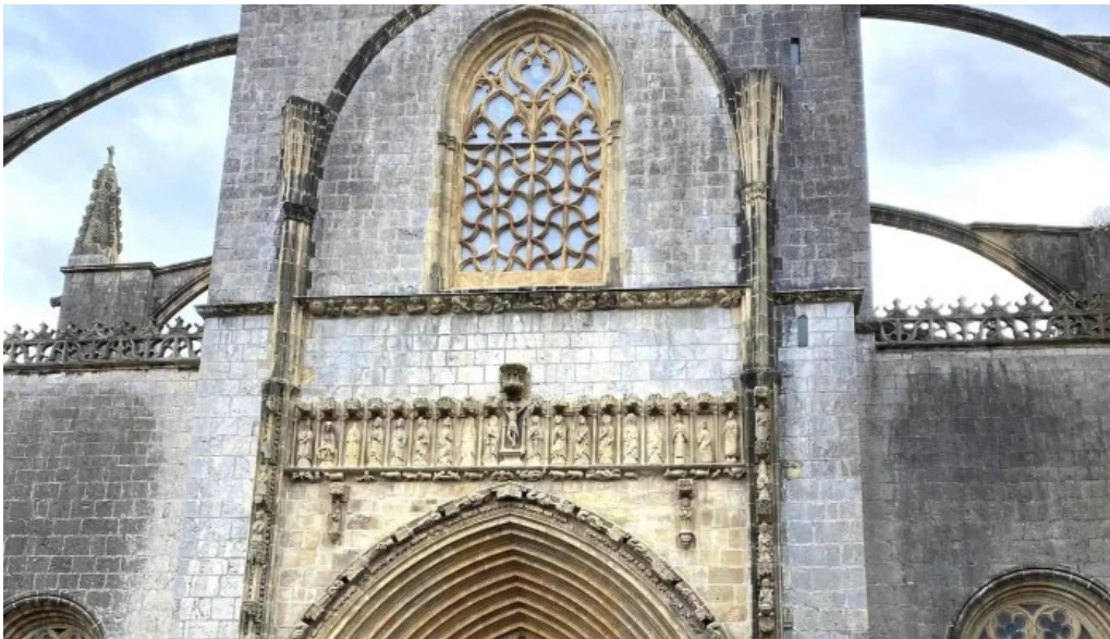
Iglesia basilica de la asuncion de maria santa maria puntaje