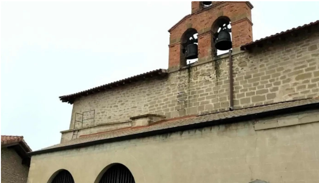
Iglesia de santa eulalia iglesia