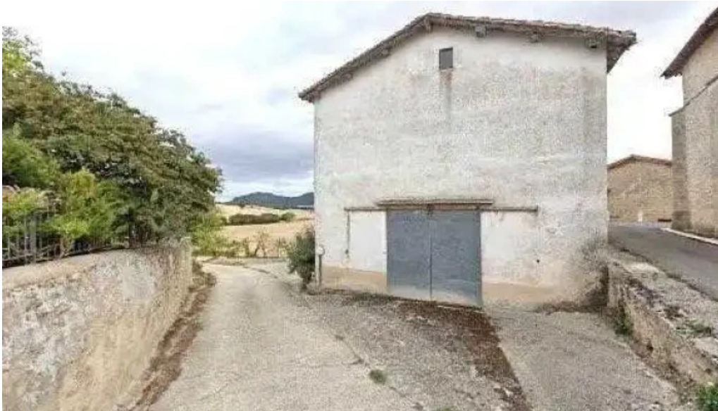
Iglesia de santa eulalia ubicacion