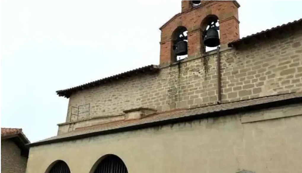
Iglesia de santa eulalia lecinana de la oca