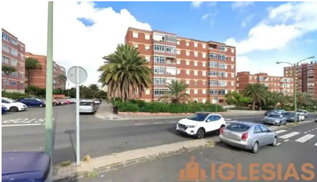
Iglesia las palmas de gran canaria