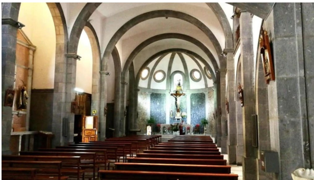
Iglesia conventual de san antonio de padua iglesia