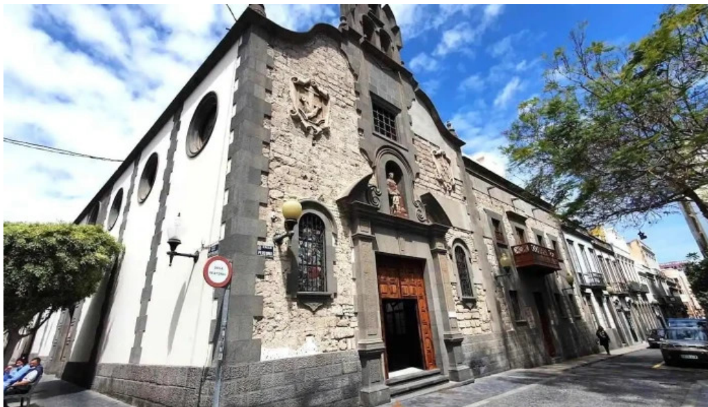
Iglesia conventual de san antonio de padua las palmas de gran canaria