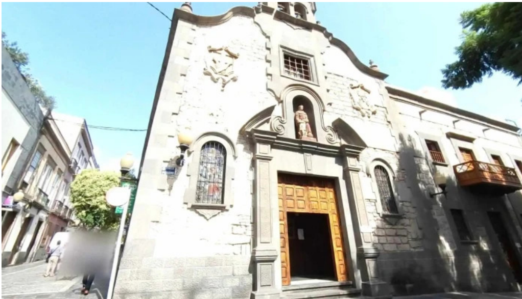
Iglesia conventual de san antonio de padua ubicacion