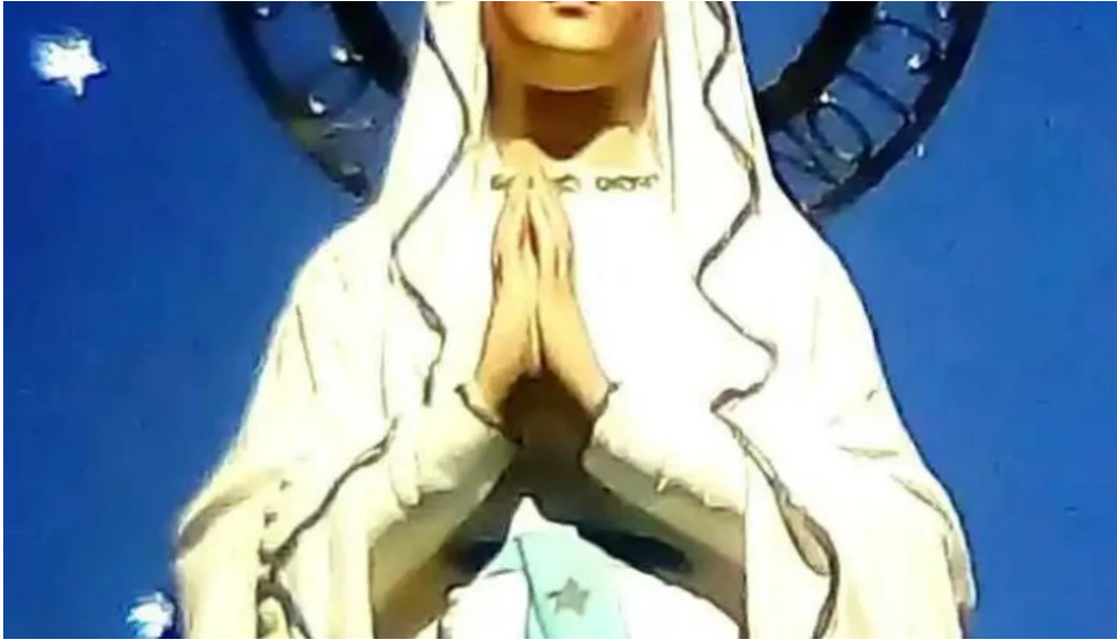
Iglesia conventual de san antonio de padua videos