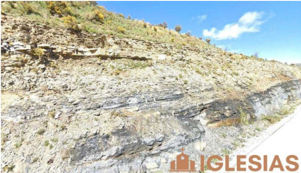
Iglesia de nuestra senora del santo sepulcro o del socorro las aldehuelas

Iglesia de nuestra senora del santo sepulcro o del socorro mapa