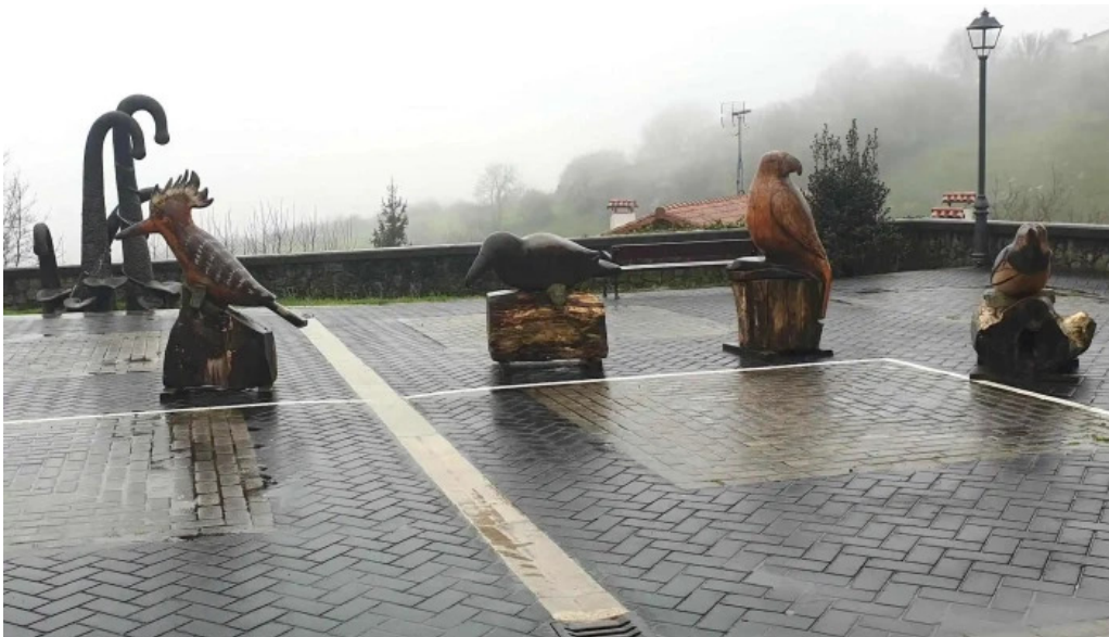
Done eztebe elizaiglesia de san esteban fotos