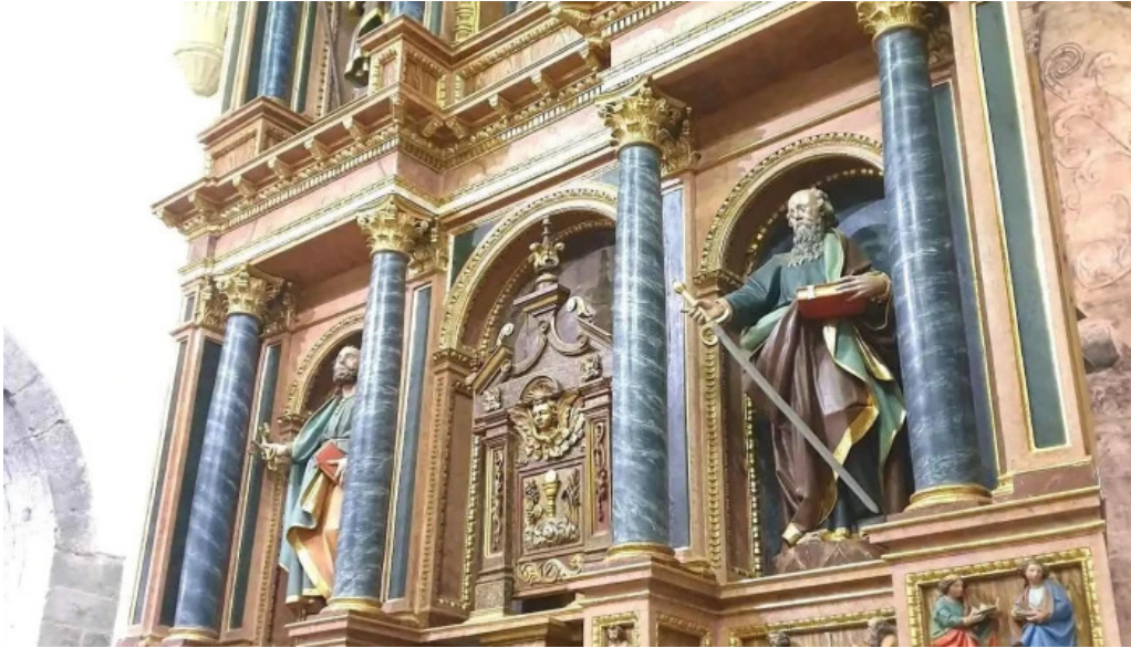
Done eztebe elizaiglesia de san esteban iglesia