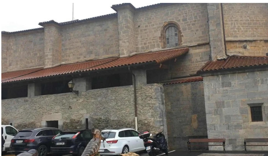
Done eztebe elizaiglesia de san esteban larraul