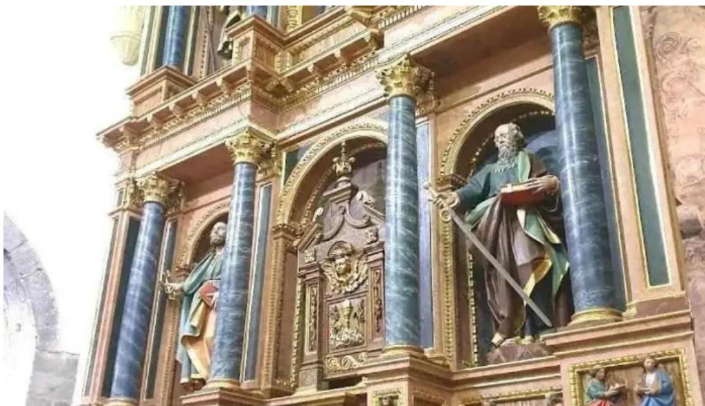
Done eztebe eliza iglesia de san esteban larraul