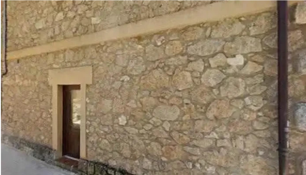
Iglesia de san cristobal descuentos