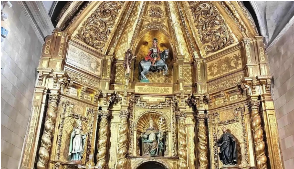
Iglesia de san cristobal iglesia