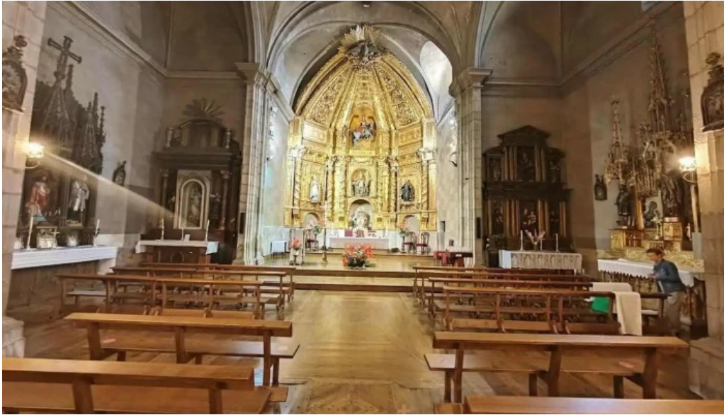
Iglesia de san cristobal larraona