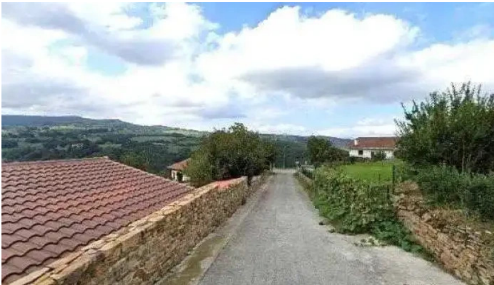
Santiago apostol iglesia