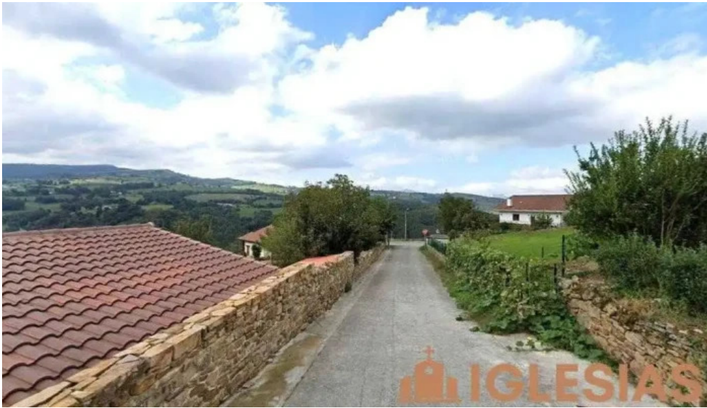
Santiago apostol lanzas agudas