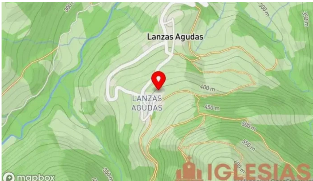
Ermita de san miguel mapa