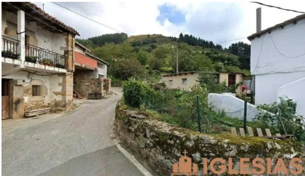
Ermita de san miguel lanzas agudas