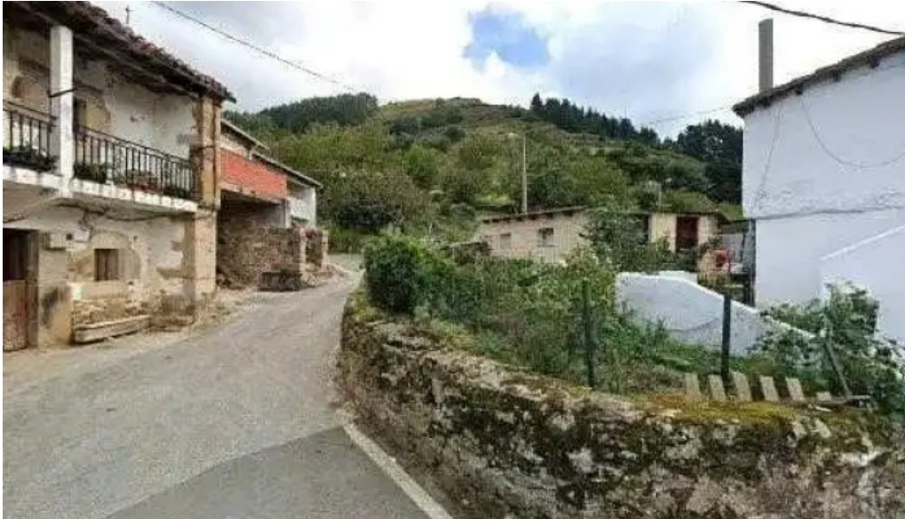
Ermite de san miguel iglesia