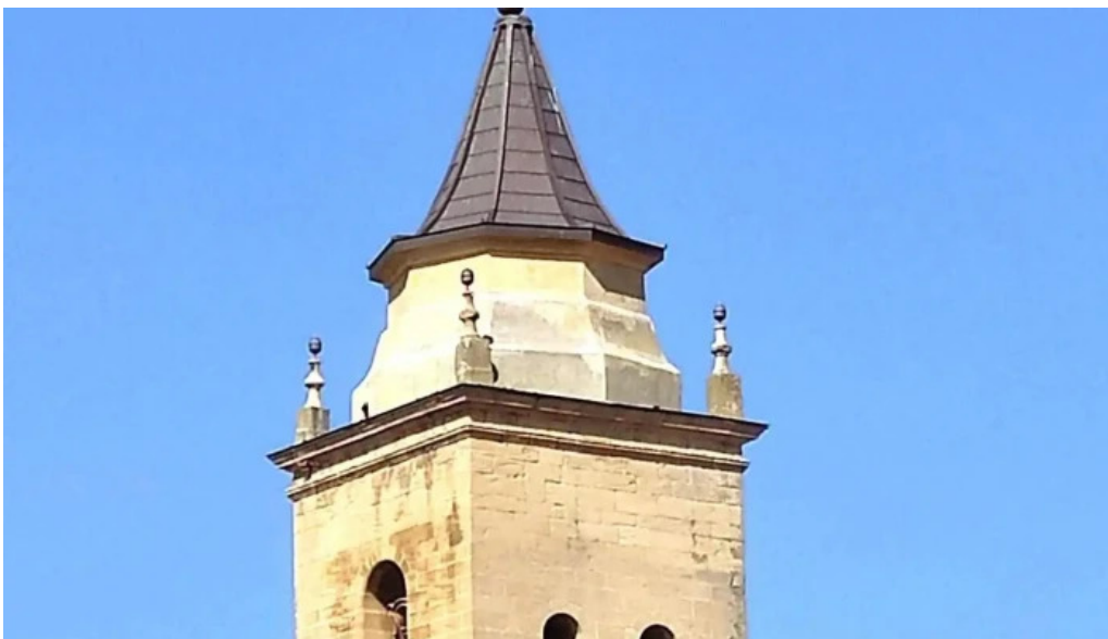
Iglesia de san acisclo y santa victoria iglesia