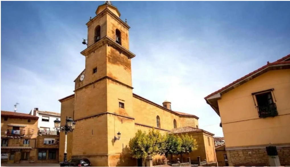
Iglesia de san acisclo y santa victoria lantziego

Iglesia de san acisclo y santa victoria mapa