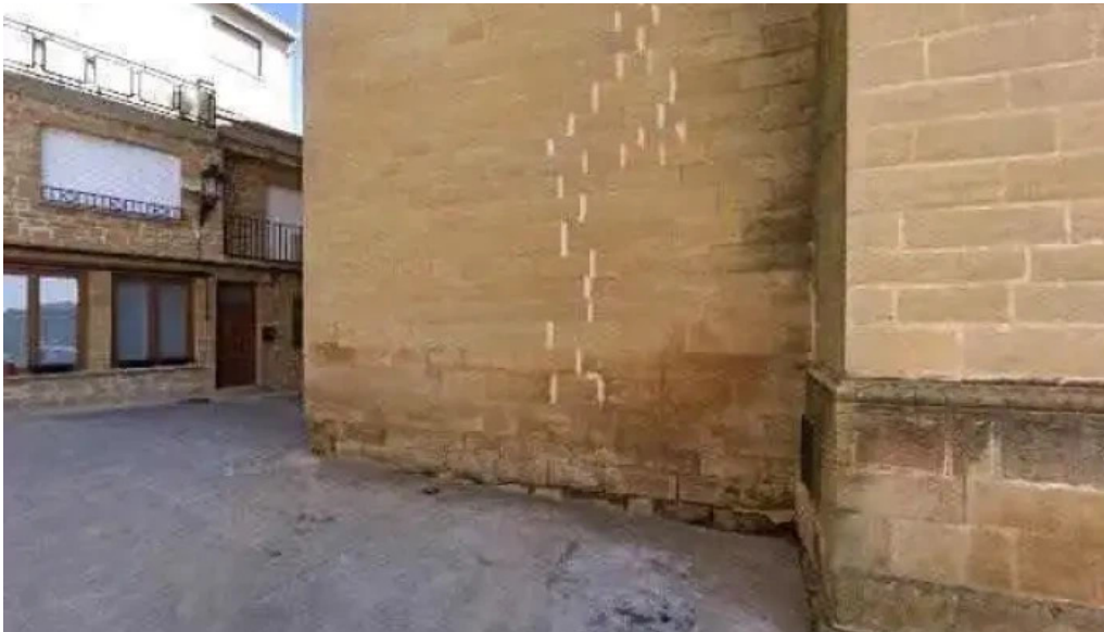
Iglesia de san acisclo y santa victoria precios