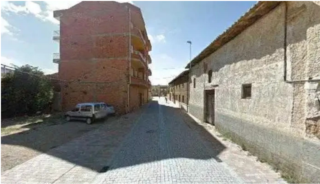
Iglesia de san juan bautista iglesia