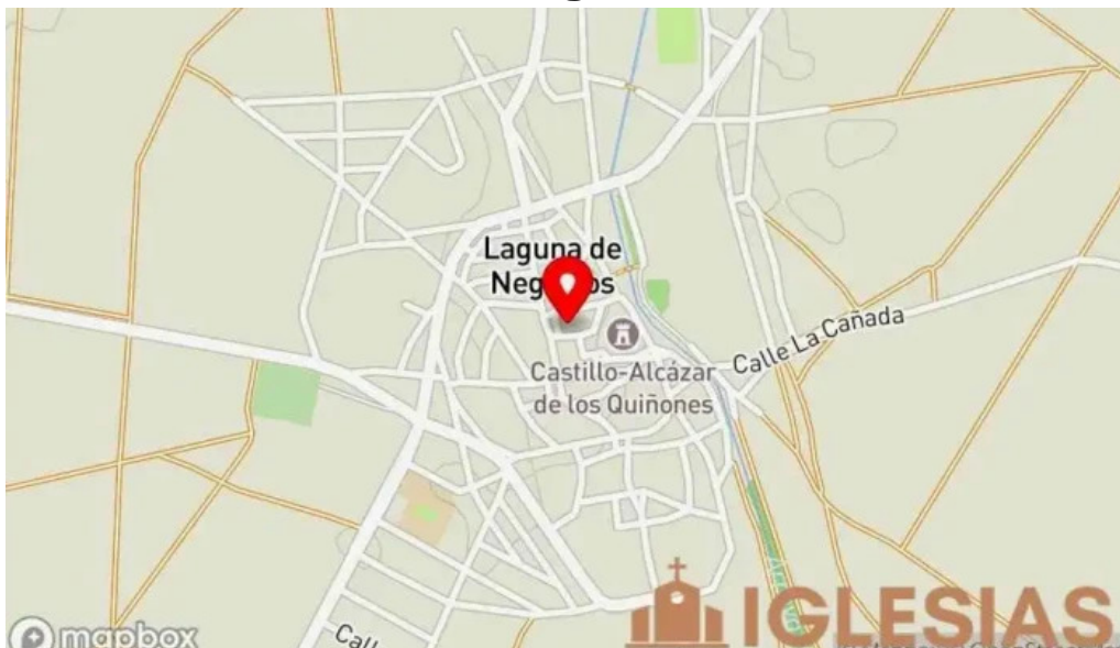
Iglesia de san juan bautista mapa