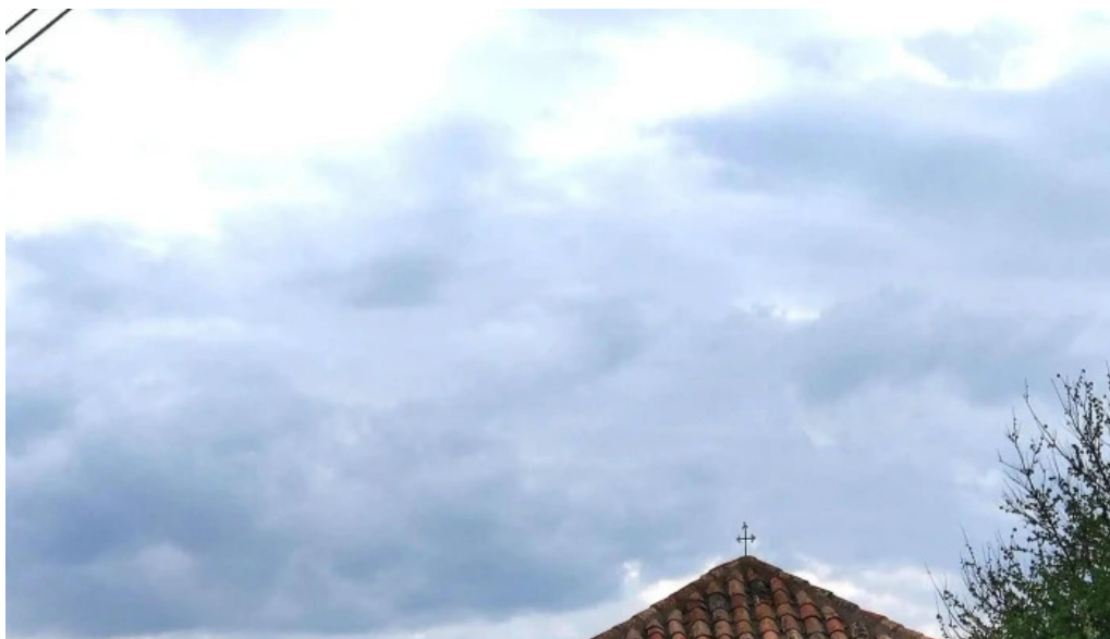
Ermita de la soledad la yunta