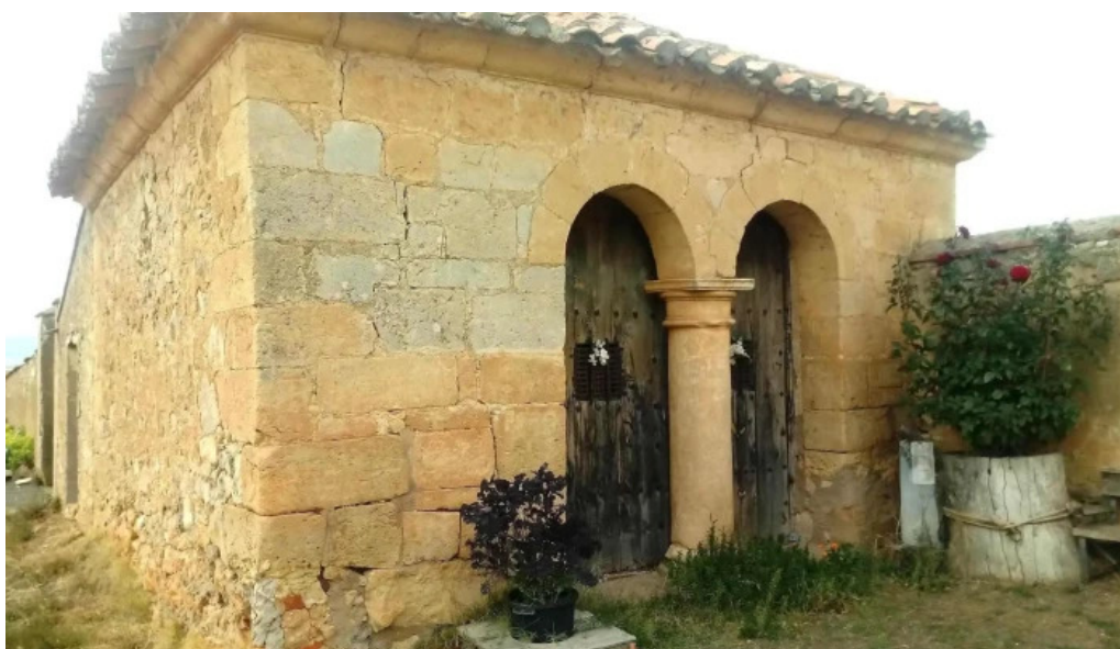
Ermita de la soledad iglesia