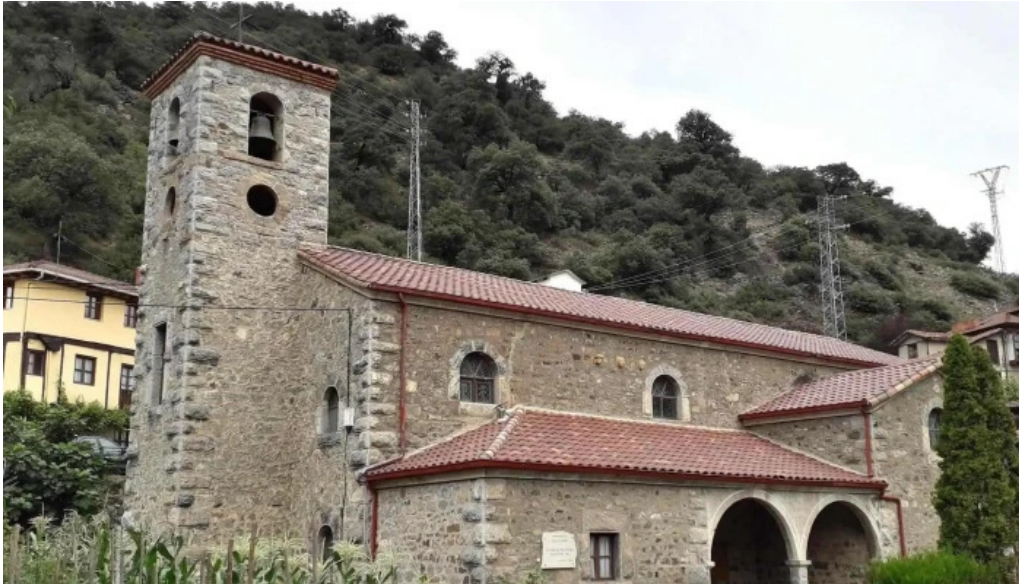
Iglesia de san vicente martir la vega