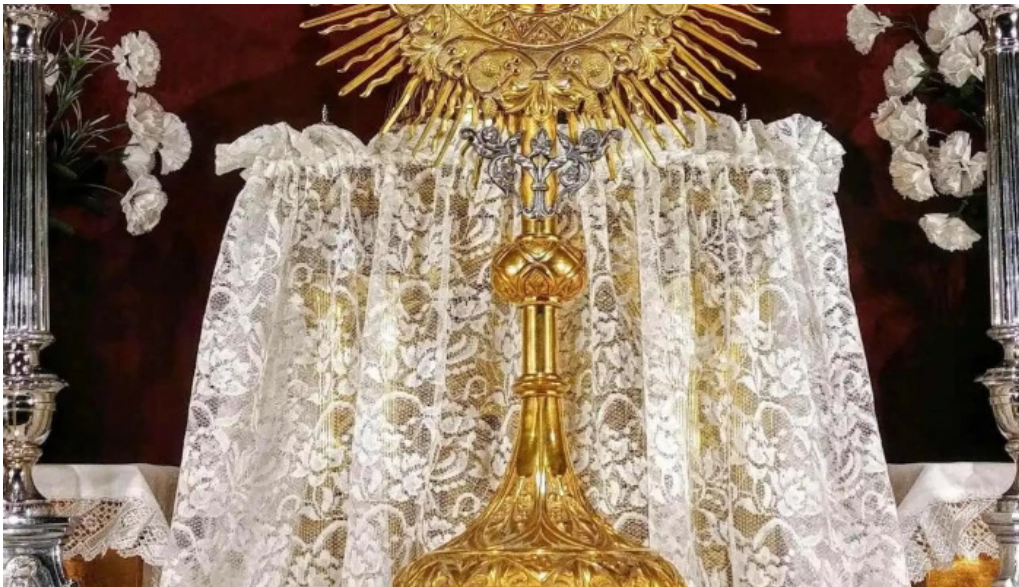
Iglesia de san vicente martir iglesia