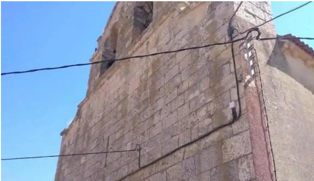
Iglesia de nuestra senora de la asuncion la sequera de haza