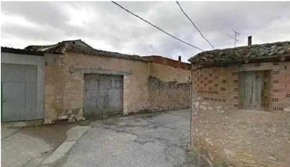
Iglesia de nuestra senora de la asuncion ubicacion