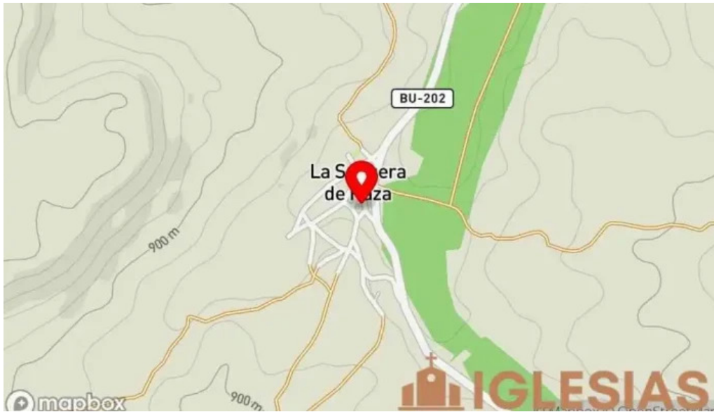
Iglesia de nuestra senora de la asuncion mapa