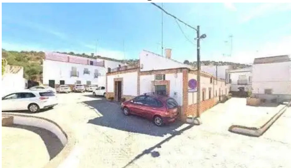
Iglesia de santa ana numero