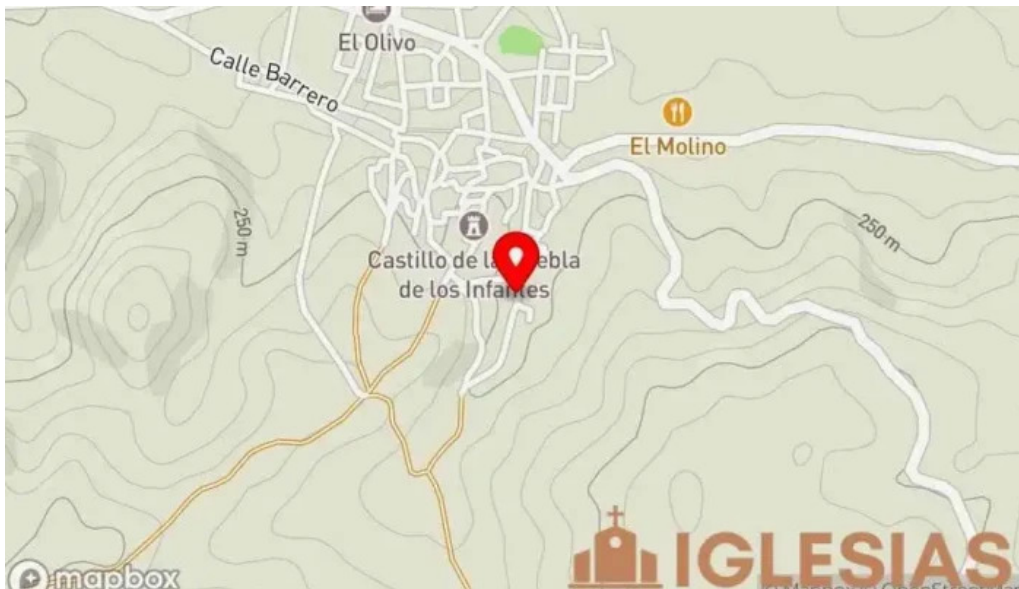
Iglesia de santa ana mapa