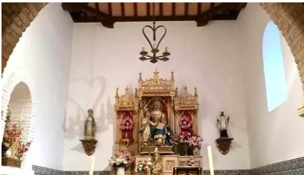
Iglesia de santa ana iglesia