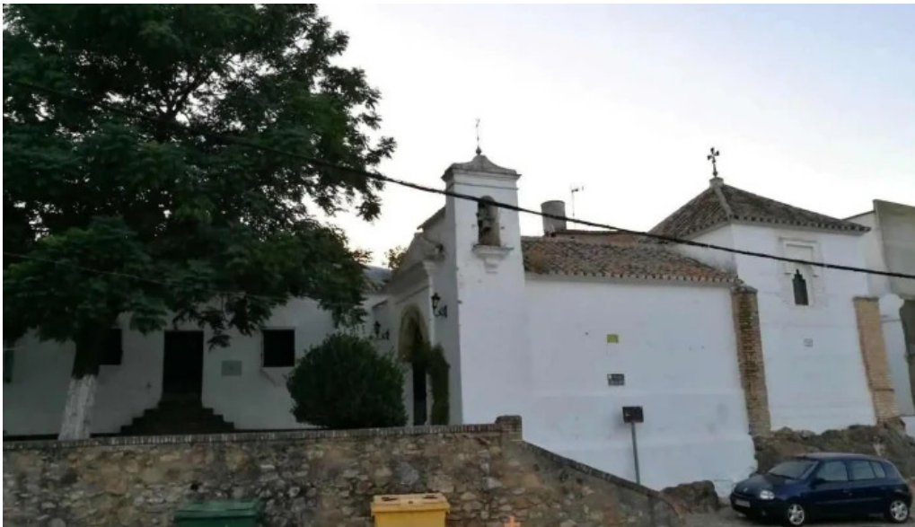
Iglesia de santa ana la puebla de los infantes