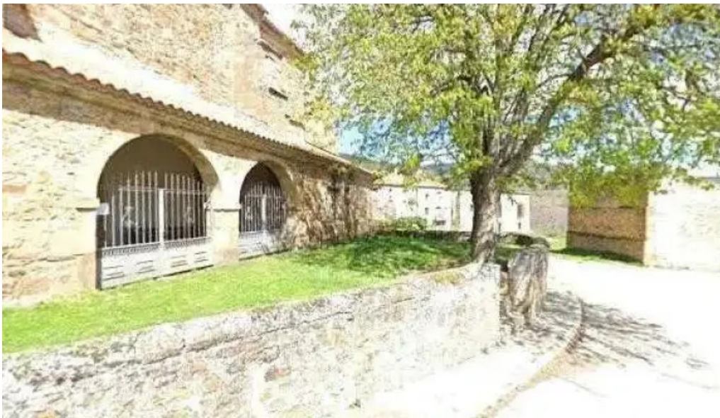
Iglesia de san salvador puntaje