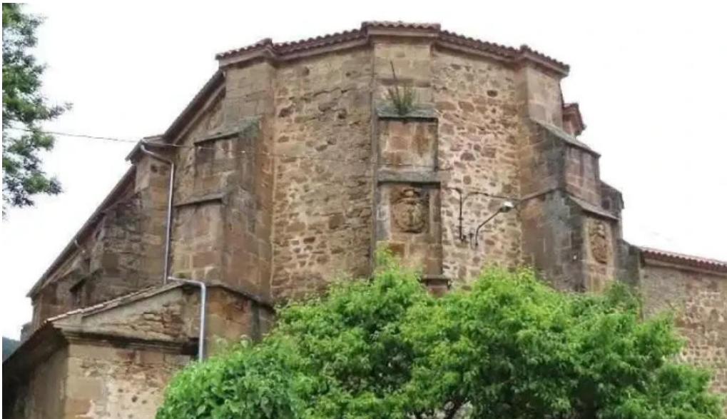
Iglesia de san salvador la poveda de soria