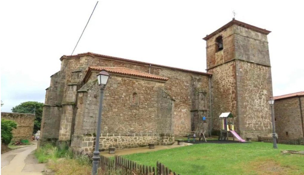
Iglesia de san salvador iglesia