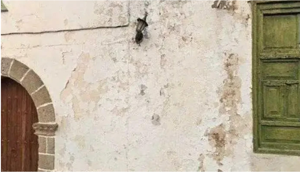
Ermita de nuestra senora de guia nuestra