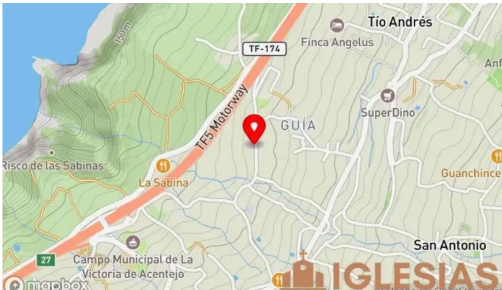
Ermita de nuestra senora de guia mapa