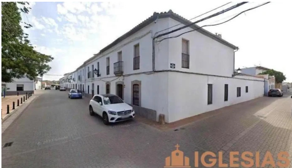
Iglesia de la granjuela la granjuela