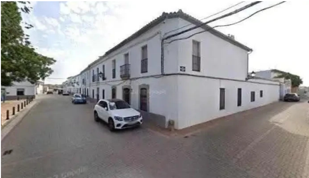
Iglesia de la granjuela iglesia