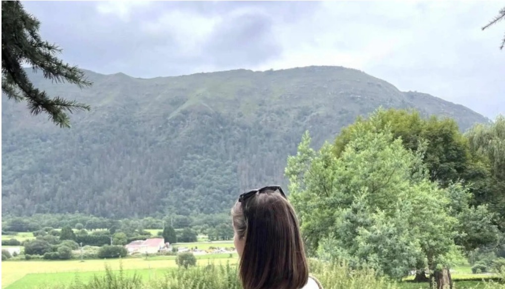
Iglesia san julian de ucieda la cuesta