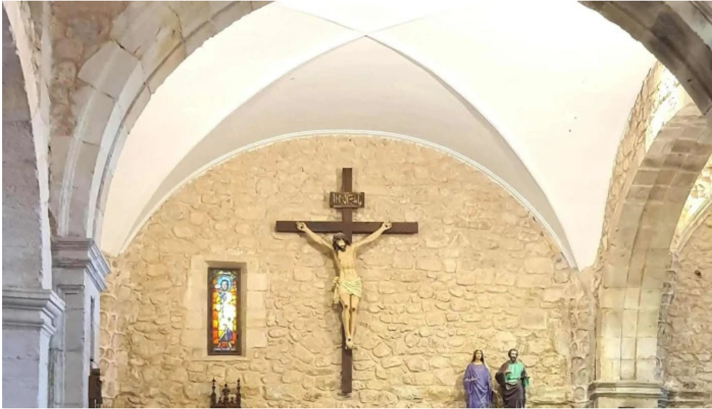
Iglesia san julian de uceda ubicacion