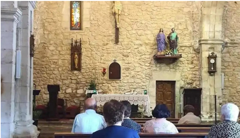
Iglesia san julian de ucieda iglesia