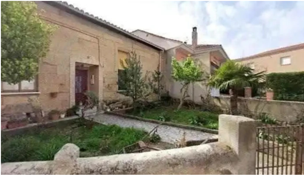
Obispado de zamora iglesia