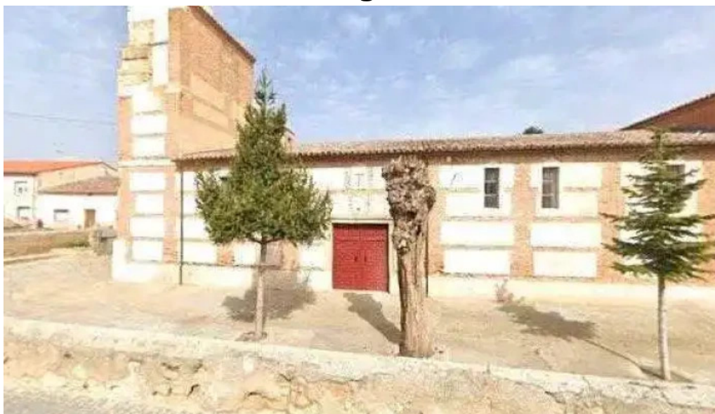
Iglesia de la bóveda de toro puntaje