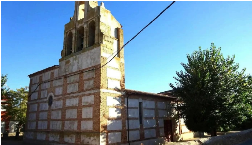
Iglesia de la boveda de toro iglesia