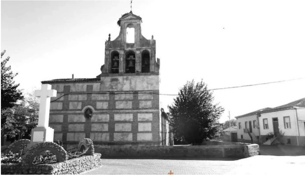
Iglesia de la boveda de toro la boveda de toro