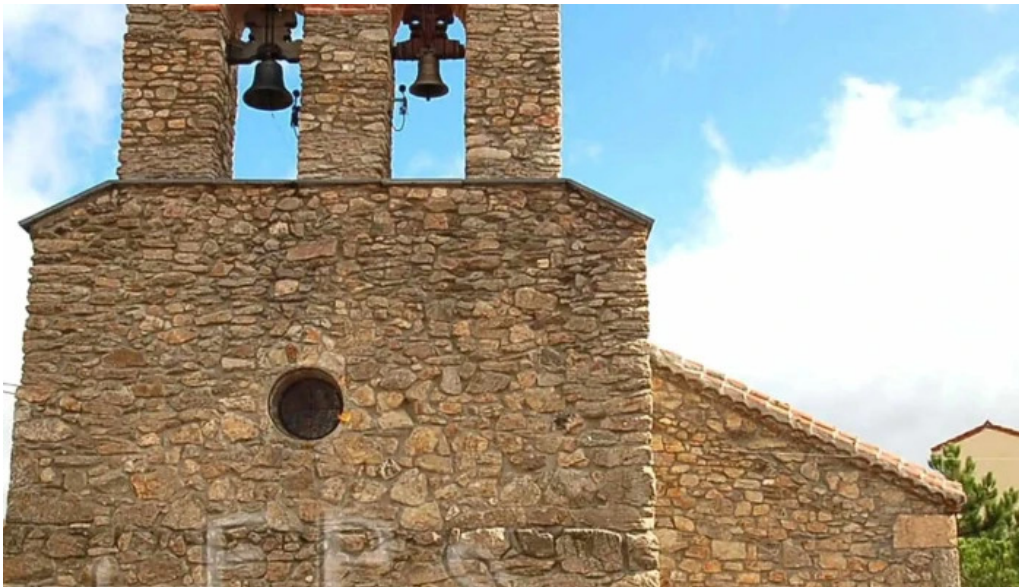
Iglesia de san sebastian s xvii la acebeda