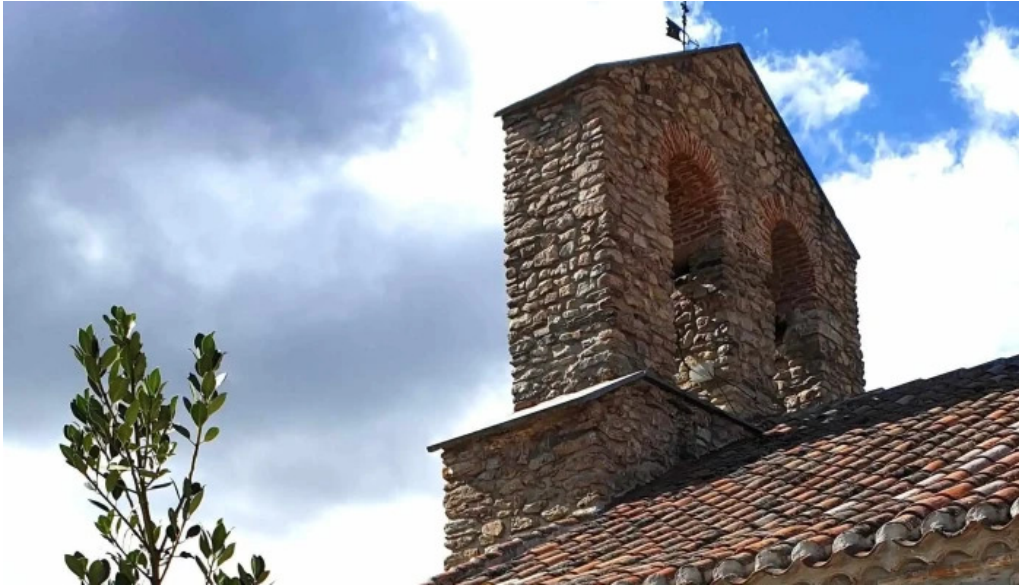
Iglesia de san sebastian s xvii zona