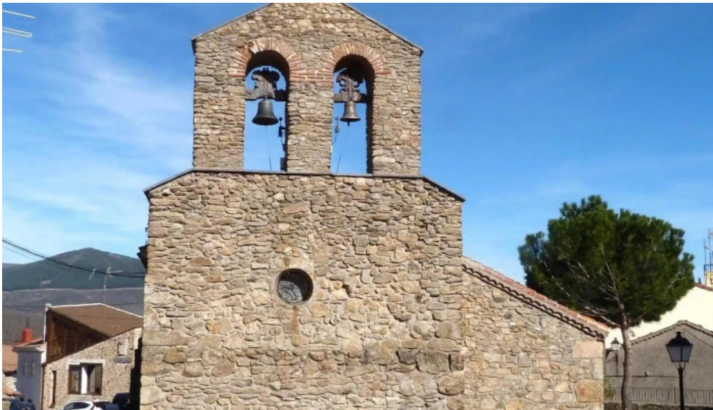
Iglesia de san sebastian s xvii numero