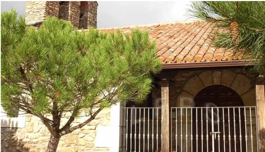
Iglesia de san sebastian s xvii sitio web