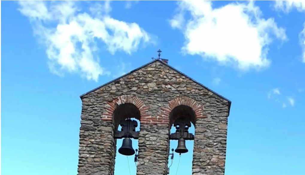
Iglesia de san sebastian s xvii opiniones