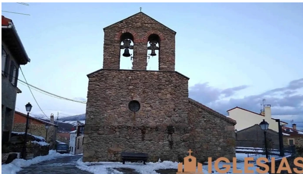
Iglesia de san sebastian s xvii iglesia