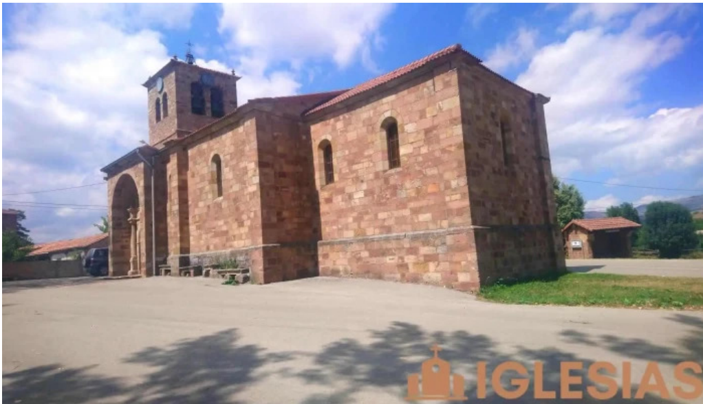
Iglesia de san andres iglesia