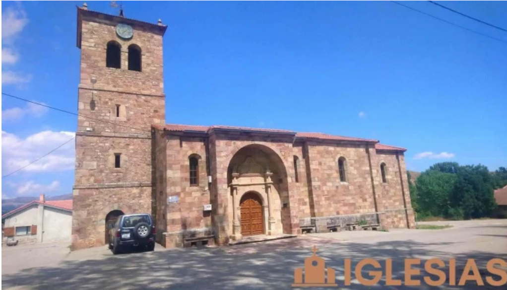
Iglesia de san andres izara