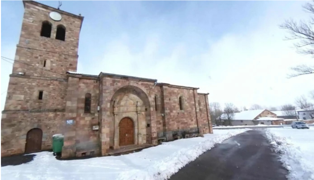
Iglesia de san andres donde