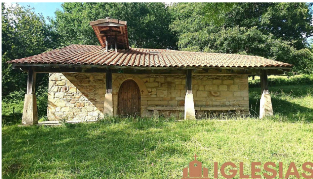
Ermita de santa marina iglesia