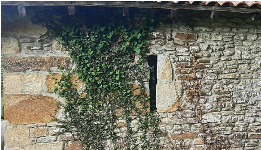
Ermita de santa marina iurreta