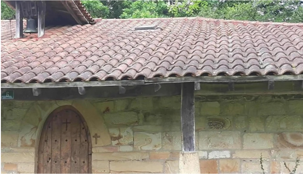
Ermita de santa marina puntaje