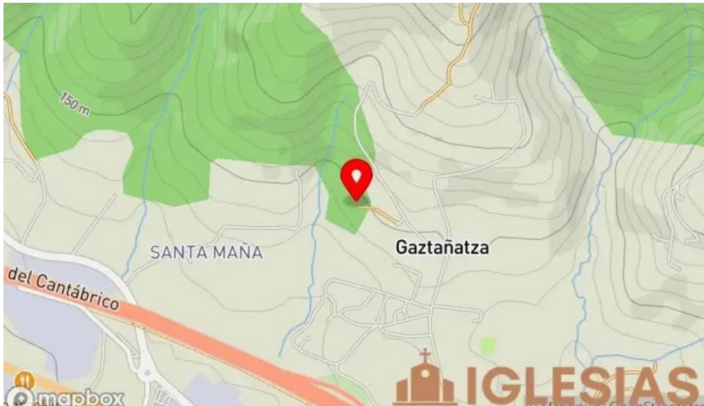
Ermita de santa marina mapa