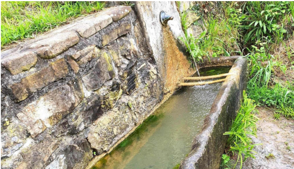
Ermita de san martin descuentos