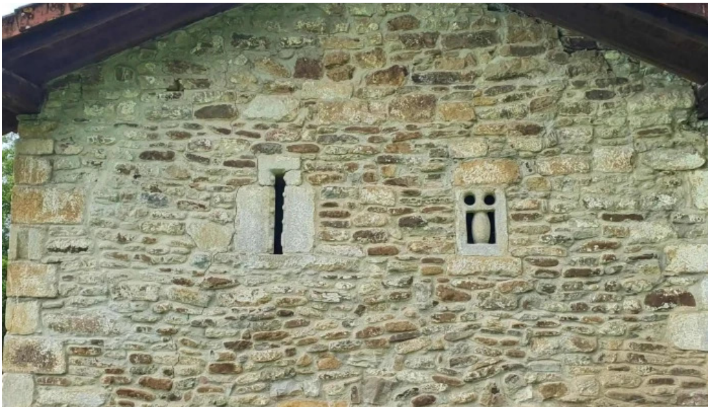
Ermita de san martin instagram