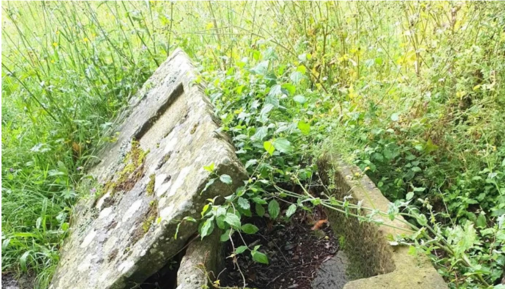
Ermita de san martin comentarios