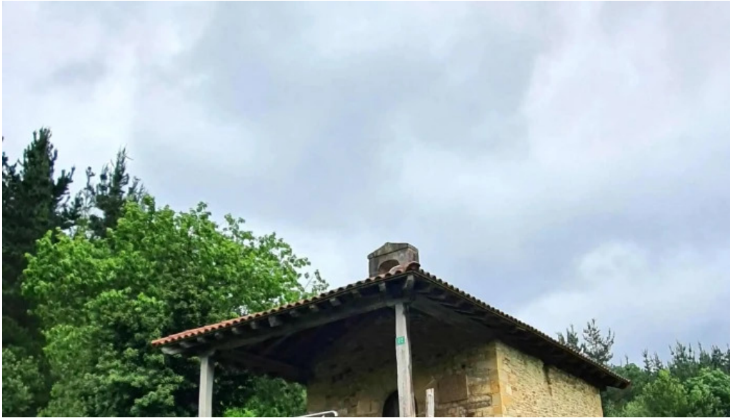
Ermita de san martin iurreta