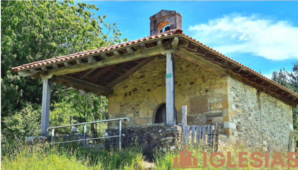
Ermita de san martin iglesia