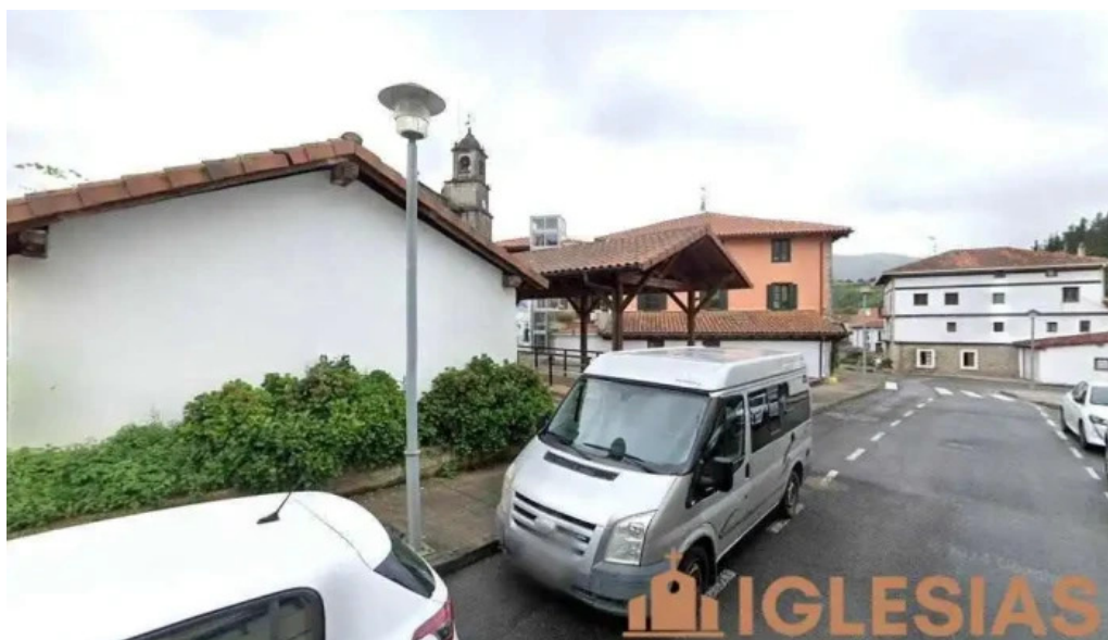
Capilla del antiguo cementerio ispaster