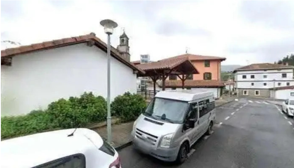
Capilla del antiguo cementerio iglesia