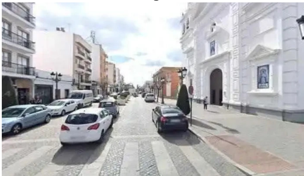
Iglesia de nuestra senora del rosario numero