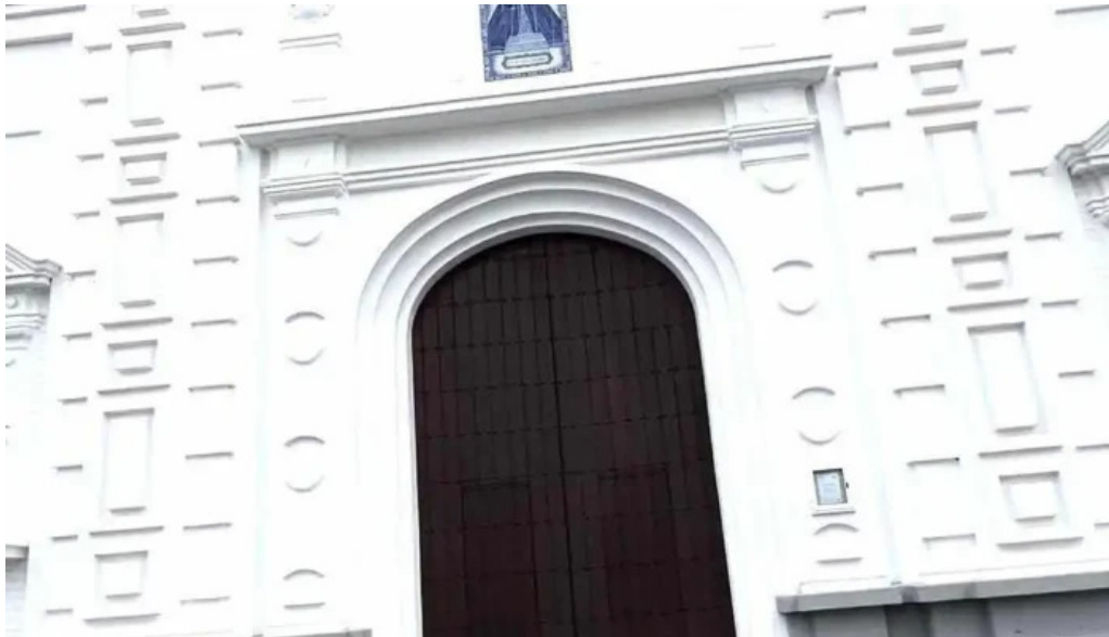
Iglesia de nuestra senora del rosario iglesia