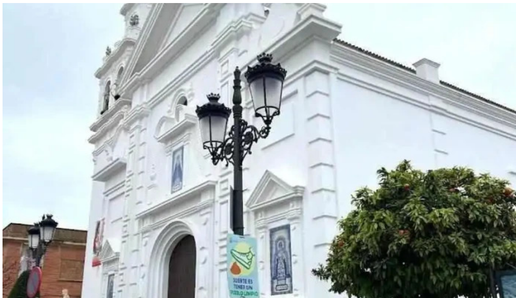
Iglesia de nuestra senora del rosario isla cristina