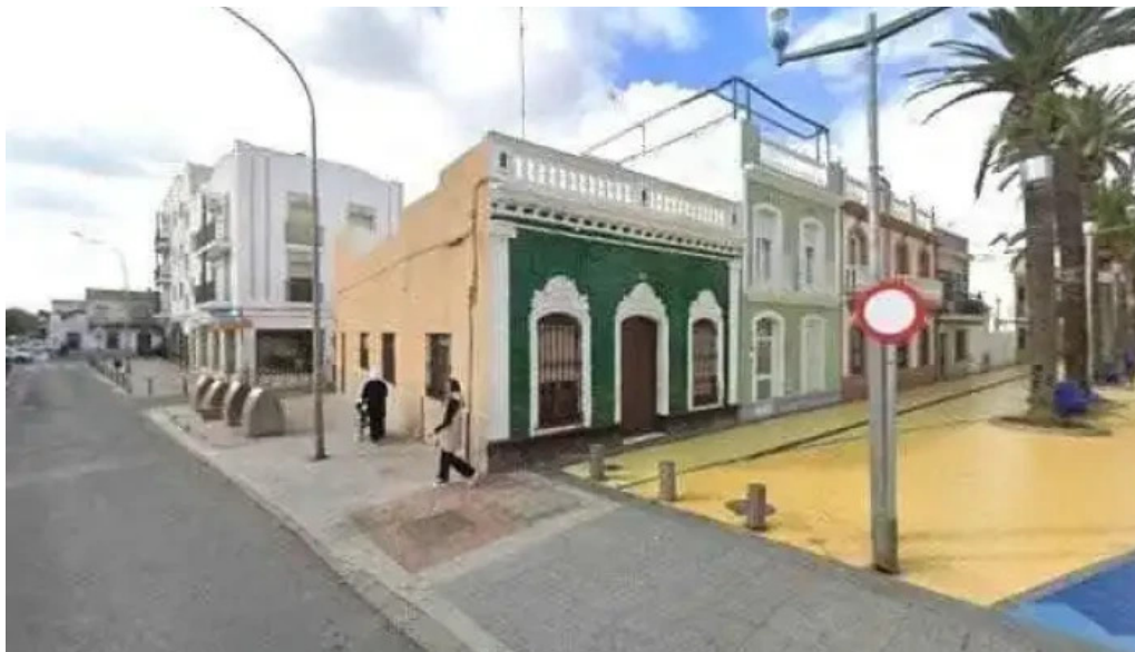
Hermandad filial de la bella isla cristina iglesia