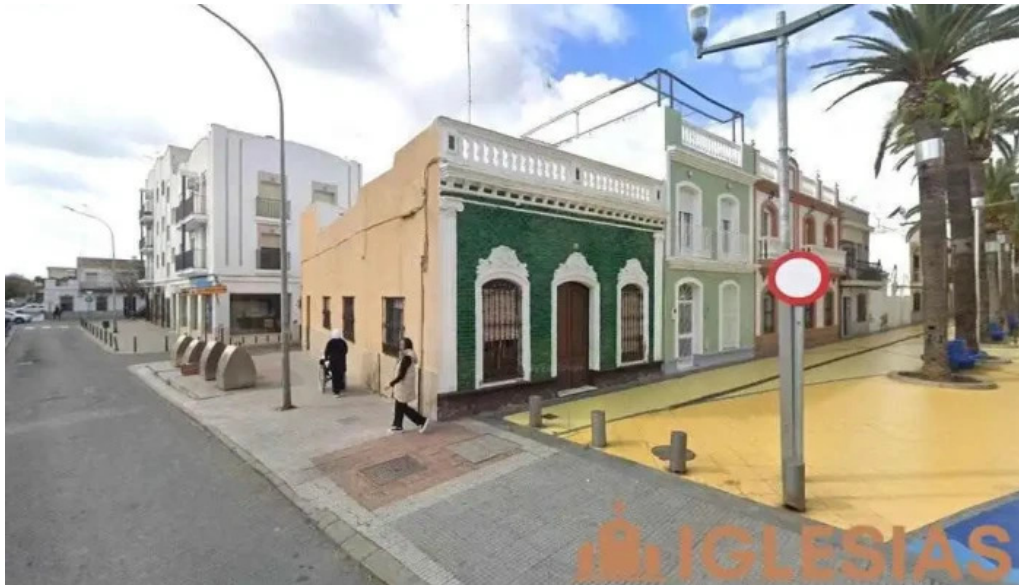
Hermandad filial de la bella isla cristina isla cristina